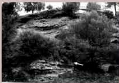
En la fotografía se observa el afloramiento de El Baradello y la flecha indica el punto exacto del hallazgo.