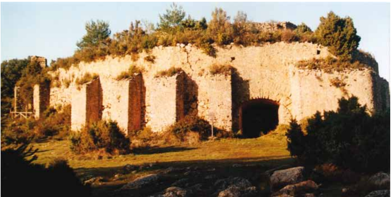
Fig. 3: foto panorámica Cava Don Miguel, Bocairent

Actualmente el fondo tiene una gruesa capa de tierra y escombros procedentes de los restos de la cubierta, y las paredes laterales del depósito están invadidas por una densa vegetación de zarza y otras especies propias de la zona (OROZCO, J. C. & SEGURA-MARTÍ, J.).