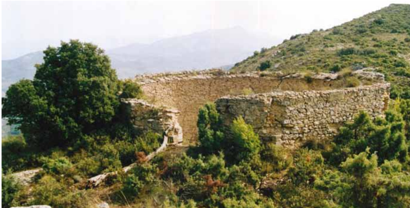
Fig. 1: panorámica de la parte superior de la Cava Don Miguel, 07/09/2003.