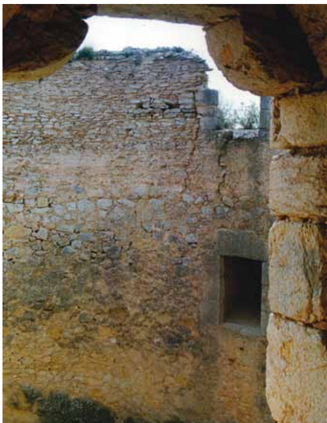
Fig. 5: Detalle de la cava en 2003

Después de la breve descripción sobre la ubicación de esta singular y espectacular cava/pozo de nieve, me gustaría hacer el siguiente comentario: