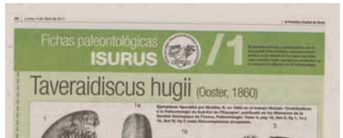
Publicación semanal de fichas paleontológicas en el periódico Ciudad