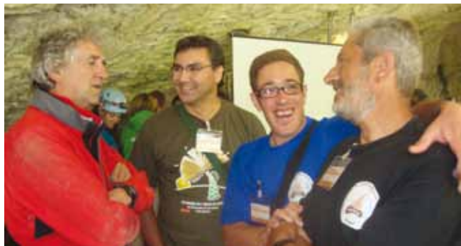
Charla con Juan Luis Arsuaga codirector del yacimiento de Atapuerca