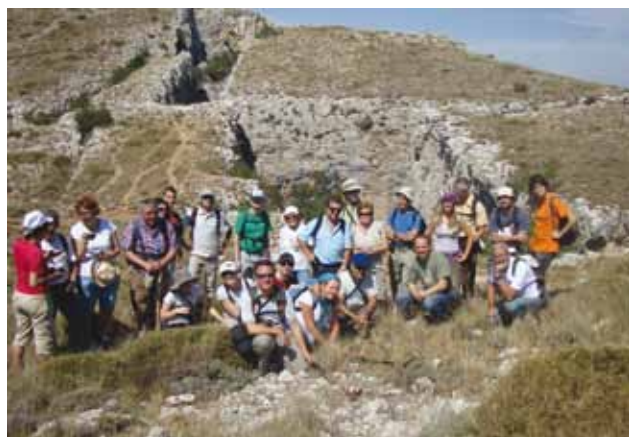
Excursión a la Sima de Partagat (Aitana)