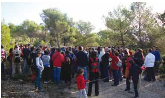
Ruta didáctica del barranc del Cint - alt de les Pedreres