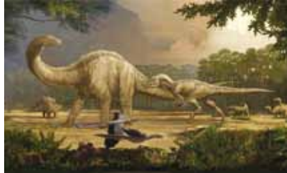
Mesozoico (245-65 ma)