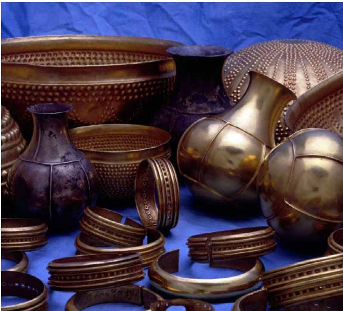
Fig. 4.- Detalle del conjunto del Tesoro de Villena anterior a la restauración en el IPHE donde se aprecia el color de la botella pequeña y la intermedia en relación con las piezas de oro.

de un conjunto eminentemente de oro, como ocurre en Villena, es difícil de explicar ya que no parece obedecer a un tipo de materia prima particular. Aunque en la actualidad existe una diferencia perceptible entre la botella pequeña, de color plateado, y las otras 2 piezas con patina negra superficial hemos de señalar que es debido al proceso de restauración y limpieza que sufrieron las piezas en 1998 en el IPHE. La botella pequeña presentaba el mismo color negro en su superficie que las otras dos piezas, como se puede apreciar en la foto tomada a principios de los años 90 por Pito Latova (fig.4.). La plata tiende al negro de forma natural por su oxidación. El oro aleado en la plata quizás pueda retrasar el proceso, pero no evita su oscurecimiento por oxidación con el paso del tiempo.