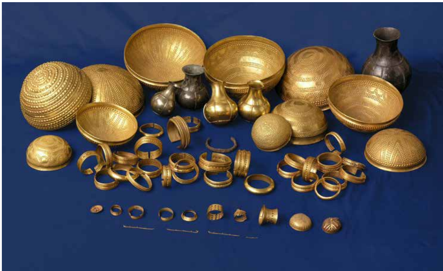
Fig. 1.- El Tesoro de Villena descubierto en 1963

superficie. Desde la moldura superior parten otras dos en posición diametral hasta cerca del borde.” 1