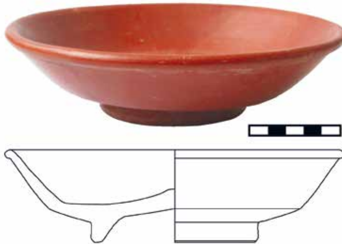
Fig. 3. Dibuix arqueològic i fotografia d'un plat complet forma Dragendorff 18, semblant al presentat en aquest treball

un marge cronològic aproximat al voltant del segle I, fins a mitjan del II dC. Es tracta d'un material escàs i poc significatiu que no permet, de moment, suggerir més enllà d'una ocupació puntual, en un context rural i que, en qualsevol cas, sembla no respondre a un hàbitat amb estructures estables i d'entitat construïdes. Pot tractar-se més aïnes d'un aprofitament, potser esporàdic, d'una modesta cavitat com a aixopluc o refugi. Cal assenyalar la proximitat del jaciment en altura de les Ermitetes, tots dos separats per poc més d'un quilòmetre en línia recta, tot i que l'ocupació romana de les Ermitetes sembla que se situaria entre els segles III i VI dC (Trelis, 2004, 52).