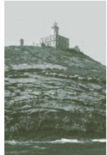
Islas Columbretes (Castellón), donde existe una microrreserva de Medicago citrina (Font Quer) Greuter.

una serie de aspectos ineludibles relacionados con la participación y la coordinación, la conservación, la prevención y el uso sostenible, la educación y la investigación, y aspectos económicos y normativos. Tras ello, en la segunda parte, se analiza la diversidad biológica española y su estado de conservación. La conclusión básica no es optimista, España detenta una muy importante biodiversidad que es necesario conservar, pero en los últimos tiempos muchos de sus componentes han sufrido un proceso de degradación muy importante, y es imprescindible frenar e incluso invertir dicho proceso. Se repasan también en esta parte de diagnóstico los principales instrumentos utilizados para la conservación. Los instrumentos sociales incluyen todo lo relativo a información, comunicación, educación y participación pública. En los científicos se hace un análisis de las líneas de investigación y bancos de información y de biodiversidad. En los institucionales y legislativos se repasan las funciones e importancia de los organismos y la legislación ambientales, resaltando dos herramientas fundamentales: la red de espacios protegidos y los libros rojos de especies. Por último, en los económicos se destaca la importancia de tener en cuenta los costes ambientales en los precios de los bienes y servicios, así como incluir los valores ambientales al calcular el valor de uso de los componentes de la biodiversidad. Esta parte de diagnóstico se cierra con un análisis de las acciones que