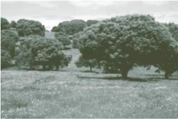
Ecosistema de debesas en la provincia de Salamanca (España).

tienen una repercusión negativa en la conservación, según los sectores sociales que las provocan. Se repasan las repercusiones de los sectores agrario, forestal, de pesca y acuicultura, cinegético y piscícola, energético, turístico, industrial, la planificación territorial, transporte, hidrológico, de la sanidad y comercial; sectores para los que se señala la necesidad de elaborar planes de acción con medidas concretas para minimizar esos efectos negativos.