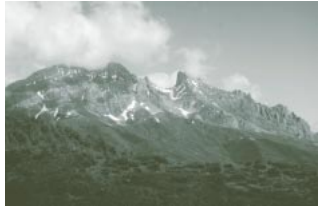
Picos de Europa, el más reciente de los parques nacionales creados en España.

con América Latina en materia de conservación de biodiversidad.