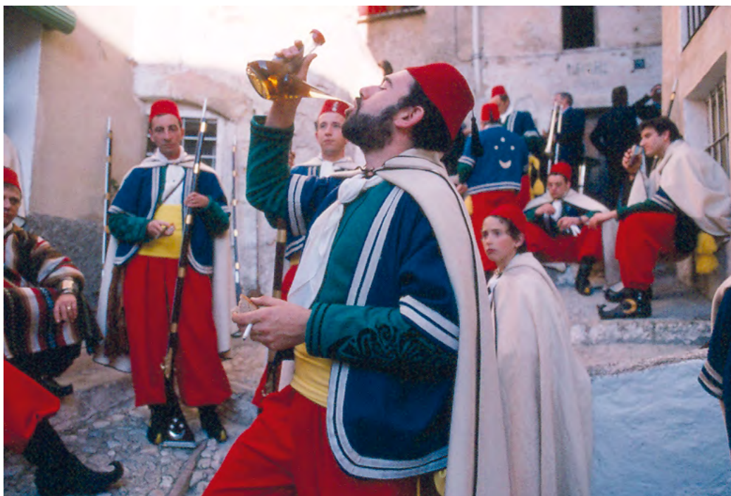
Fig. 6: Membres de la Filà de Marrocs, Bocairent.