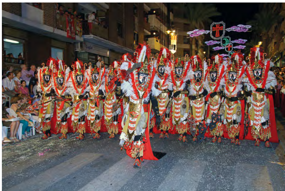
Fig. 4: Entrada mora d'Ontinyent.

Un acte que en poc temps, des d'aquella data documentada de 1839, començarà a anar introduint-se de manera gradual a partir de la dècada de 1860 en totes aquelles poblacions de l'entorn geogràfic i econòmic