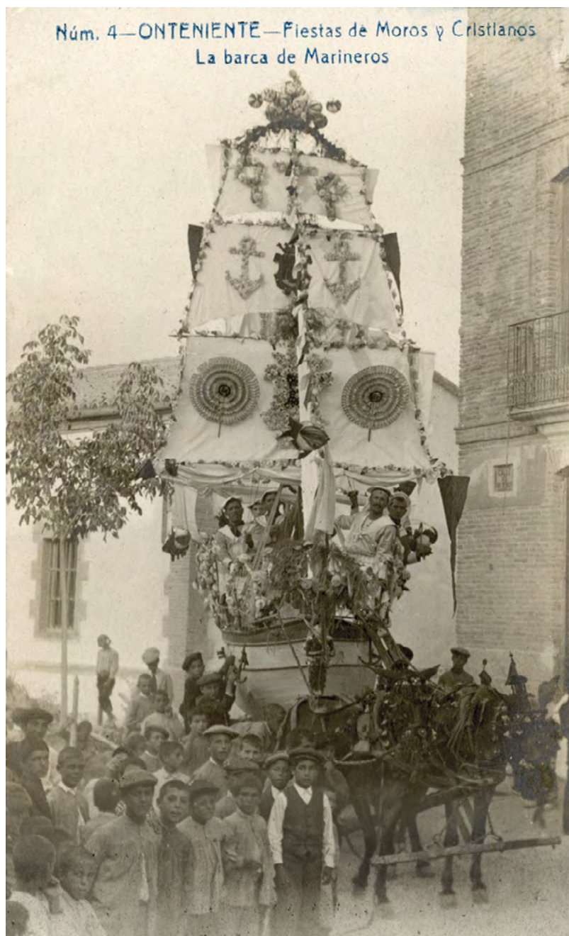
Fig. 8: Ontinyent. Barca dels Mariners que s'emprava a principis del segle XX en els actes de l'entrada cristiana i de la Nit del Riu.

La funció de Moros i Cristians, documentada per primera vegada a Villena en 1843 (Domene Verdú, 2018), sumaria al llarg del segle XIX, a les inicials comparses de Moros (des de 1868 Moros Viejos) i Cristians (hereva segons el mateix Domene Verdú de l'antiga soldadesca del segle XVIII), les de Moros Nuevos (1854), Marroquí (1866, en l'actualitat Bando Marroquí) i la desapareguda Moros Guerreros (entre 1869-1884), en el bàndol moro; i les de Estudiants (1845) i Marineros (entre 1869 i 1884, hui Marinos Corsarios) i les desaparegudes Romanos (fundada abans de 1849) i Tercios de Flandes (entre 1869-1884), en el cristià.