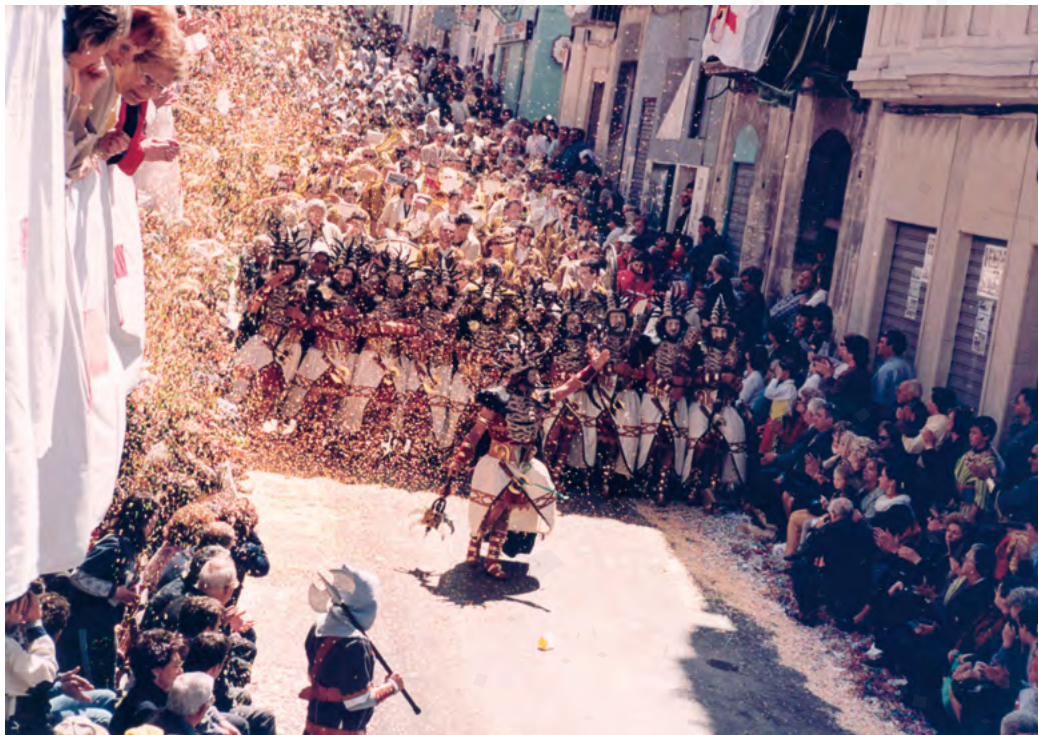
Fig. 3: Un moment de l'entrada del bàndol cristià a Alcoi. Esquadra especial de l'alferes, Filà Gusmans, 1999.

A partir del Cronicón 2 del Pare Picher s'obté un relat exacte de com es desenvolupà la festa aquell any. Una acció que Mansanet (1981) i Domene (2015), veuen com inici d'un nou model de festa, ja que queda instaurada una seqüència ritual d'actes distribuïda en tres dies que donaran peu a allò que es coneix com trilogia festera, i en la que Domene (2015:19-21), troba explicitada la configuració del tipus de festa que ell anomena alcoià, conformat a partir de l'articulació en tres jornades de tres tipus de festa precedent: la militar, reflectida en l'entrada, la religiosa, en la processó de Sant Jordi, i la popular fonamentada en un element històric, en els alardos i ambaixades.