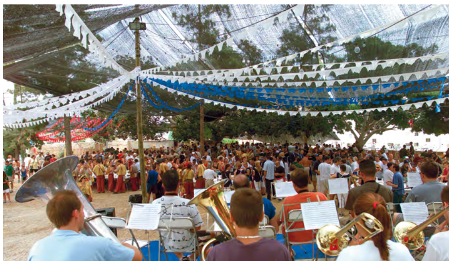
Fig. 7: Quarter del rei cristià, Festes de Moros i Cristians de La Vila Joiosa, 2003.

A Muro, es sap de l'existència des de mitjans del segle XIX (Pascual i Gisbert, 1987-1996), de l'actual filà Llana (1877) i la desapareguda Mo-