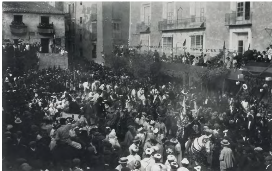
Fig. 5: Entrada de moros i cristians, la Vila Joiosa, 1926.

l'associació que naix com impuls bàsic de les persones, proposa per al cas de les manifestacions festives una propietat més respecte el sentit lúdic, artístic o esportiu que, al·ludeix Simmel: el propi sentit de sociables de les activitats de celebració festiva.