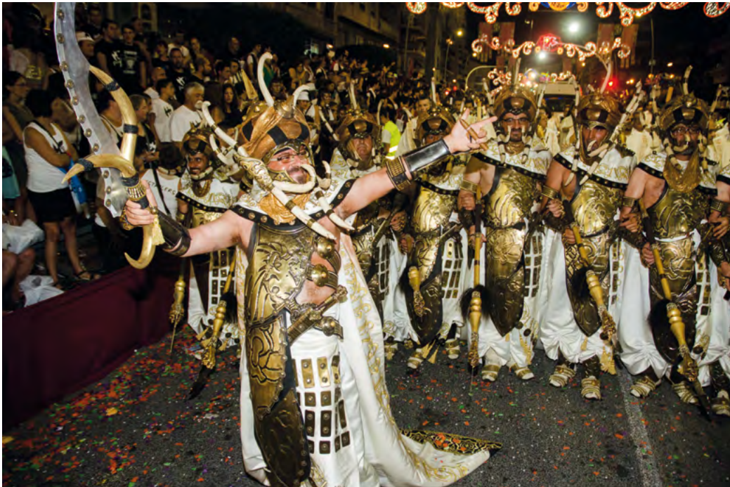
Fig. 1: Entrada Mora a La Vila Joiosa.