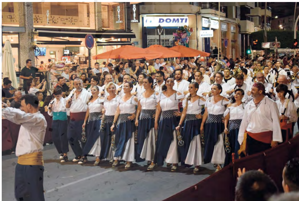
Fig. 9: Entrada cristiana, La Vila Joiosa, Companyia de Pescadors, 2019.

de Suavos Pontificis i Llauradors, en 1878 i 1883, respectivament; i als moros, la de Moros de la Seda i de la Llana 9 (1861-1862), de Moros Marinos (1865), Càbiles (1878) i Turcs (1878).