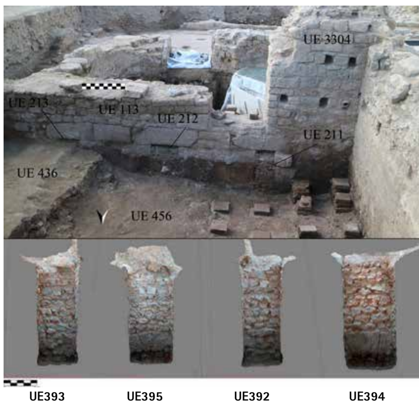
FIGURA 5. Superior: vista de la nueva sala calefactada en la que se aprecian parte de las pilae del hipocausto, los orificios de la concameratio y los canales de aire caliente que comunican con la estancia lobulada. Molina, Muñoz y Álvarez, 2019, p. 81, fig. 63. Inferior: ortofoto de las cuatro paredes del registro de la cloaca. Molina, Muñoz y Álvarez, 2019: 113, fig. 90.

análisis parietal evidenciaba que esta sala había experimentado varios y profundos cambios durante el tiempo que estuvo en uso. Así lo constataba el empleo de distintos aparejos en sus muros y la presencia de varias capas de enlucido, donde observamos la superposición de hasta tres revoques en algunos de sus lienzos. Quedaba plenamente justificado, por tanto, realizar un sondeo en su pavimento y excavar bajo del mismo con el fin de obtener más información acerca de la evolución de este espacio. Tras retirar parcialmente la capa de opus caementicium y su rudus se detectaron restos de estructuras con una orientación distinta a la vista en las termas (Molina, Muñoz y Álvarez, 2019: 20–49). Podríamos estar ante construcciones previas que fueron amortizadas con la construcción de las termas, aunque tampoco podemos descartar que estemos ante los vestigios de una reforma del propio complejo termal. En cualquier caso, lo cierto es que la información recabada en esta zona todavía es muy parcial y se precisarían nuevas intervenciones en esta zona que faciliten más datos (fig. 6).