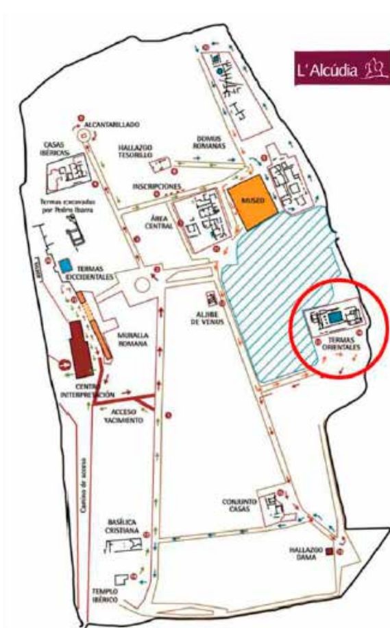
FIGURA 2. Plano general del yacimiento arqueológico de La Alcúdia (Elche, Alicante) con las Termas Orientales destacadas en rojo. Realizado a partir de Abad y Tendero, 2008: 45.

de acondicionamiento de la parcela en la década de los 60 del siglo XX se halló fortuitamente un tramo de alcantarillado romano. A. Ramos Folqués vació su interior sin que, en el proceso, se descubriese su rela-