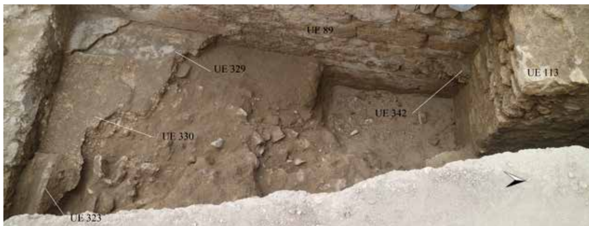
FIGURA 6. Vista en detalle del escalón y de los restos de pavimento del espacio anexo a la sala del labrum . Molina, Muñoz y Álvarez, 2019: 91, fig. 73.

afectar los cambios del viario y de la red hidráulica a las termas –y viceversa–.