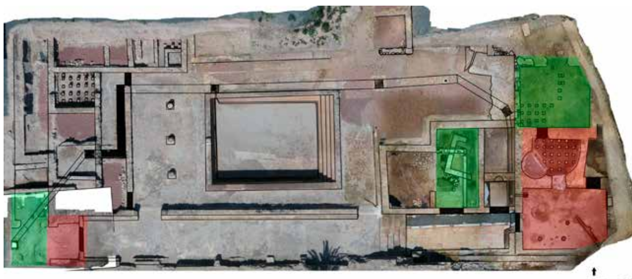
FIGURA 3. Plano de las Termas Orientales. Las zonas sin colorear fueron exhumadas en las campañas 1998-2002. Las zonas destacadas en rojo corresponden a la campaña 2017 del proyecto ASTERO y las destacadas en verde a la campaña 2018.

En lo que respecta a la zona oriental, la sala lobulada con hipocausto que fue excavada en 2017 se abría a otra habitación hacia el norte. La apertura de esta zona reveló que se trataba de una amplia estancia cuadrangular en la que se registraron, al menos,