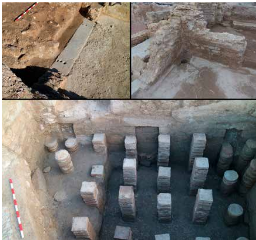
FIGURA 4. Superior izquierda: vista en detalle del umbral del extremo oeste. Superior derecha: vista en detalle de la estancia pavimentada en opus signinum donde se aprecia el emplazamiento del labrum . Molina, Muñoz y Álvarez, 2018: 55, fig. 28. Inferior: vista en detalle del hipocausto de la estancia lobulada.

dos ocupaciones o usos posteriores al original. Nos centraremos en esta última. En su momento inicial era una habitación calefactada que quedaba integrada en el circuito de las termas descubierto en la campaña precedente. Tal y como ya ocurría en la estancia previa su pavimento fue destruido en el momento de amortización de las termas, dejando expuestas las pilae de su hipocausto. Contaba además con orificios en sus paredes repartidos regularmente por encima de la línea de pavimento. Alguno de ellos todavía contaba en su interior con fragmentos de clavi coctiles cerámicos para el anclaje de una pared externa, de tal modo que se generase una cámara para la circulación del aire caliente. Tres grandes canales abiertos en el muro sur de la estancia servían para conducir el calor a la sala lobulada que la precede. Del mismo modo, los restos de dos arcos en la pared norte muestran que también había una comunicación entre este hipocausto y la estancia situada más allá de su límite septentrional, cuya excavación fue prevista para la campaña 2019. Los trabajos arqueológicos planteados en este ambiente en la campaña de 2018 se detuvieron al comenzar a aflorar las primeras pilae del hipocausto, quedando pendiente su finalización para el próximo año. Siendo así, no podemos asegurar que estos puntos de comunicación de aire caliente –canales y arcos– sean todos los existentes.