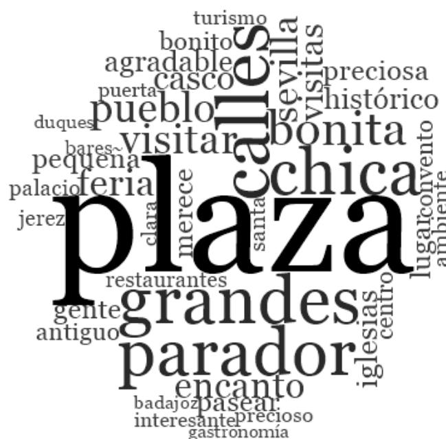
Figura 2: Nube de palabras

Elaboración propia mediante el software NVIVO Pro 11.