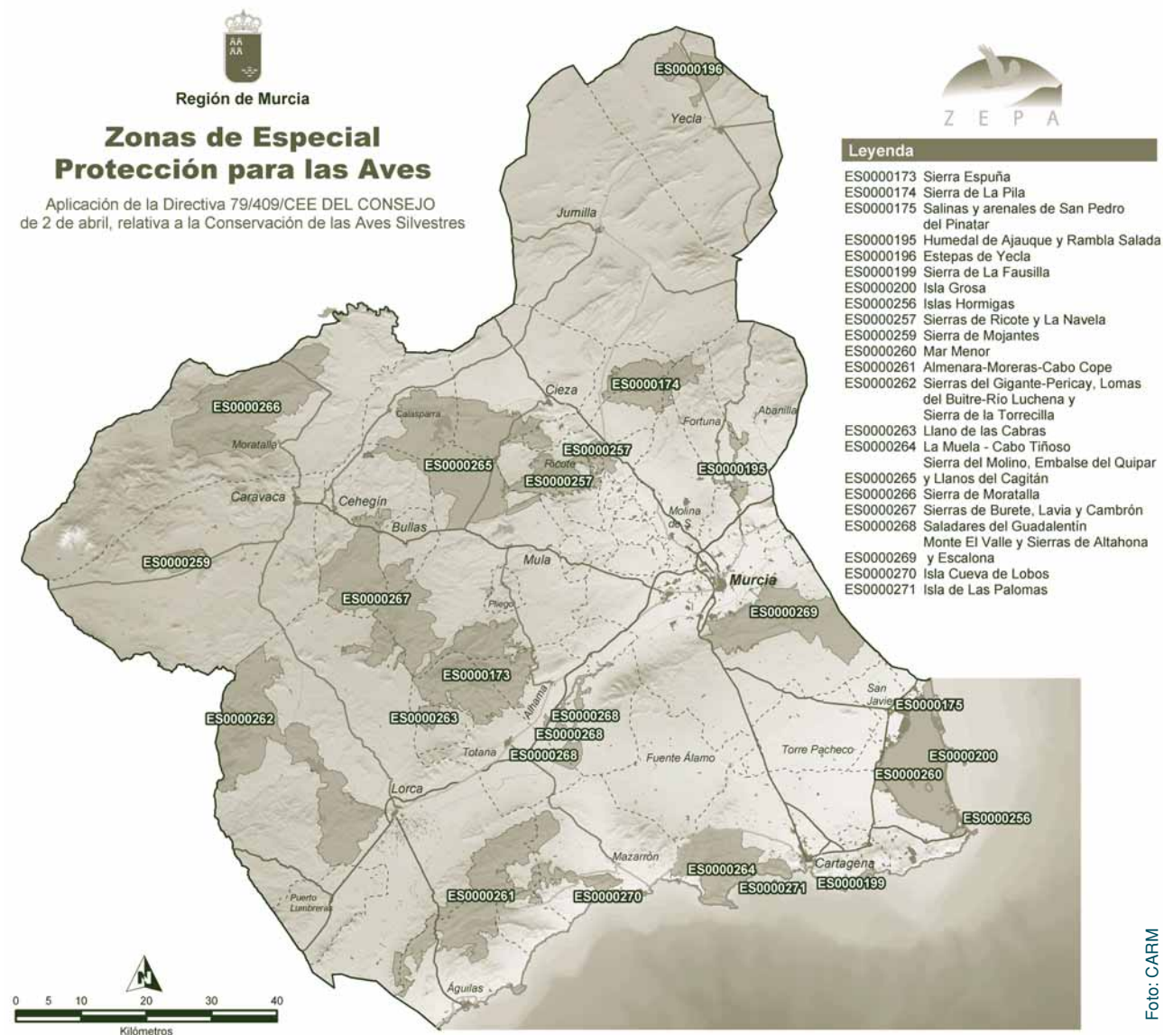
Mapa 2. Zonas de Especial Protección para las Aves (ZEPAs) en la Región de Murcia.

mentación de proyectos prácticos de gestión de zonas costeras mediterráneas basados en los principios de desarrollo sostenible y en respuesta a los problemas ambientales, utilizando como herramienta básica la Gestión Integrada de Zonas Costeras (GIZC). La propuesta de realizar un proyecto en el Mar Menor constituye la primera iniciativa para el Mediterráneo occidental de la Unión Europea pues en su entorno confluyen importantes valores ambientales y culturales: especies de fauna y flora singulares y endémicas, riqueza y diversidad de hábitat, representatividad de hábitat y especies de las Directivas europeas, Convenios internacionales y