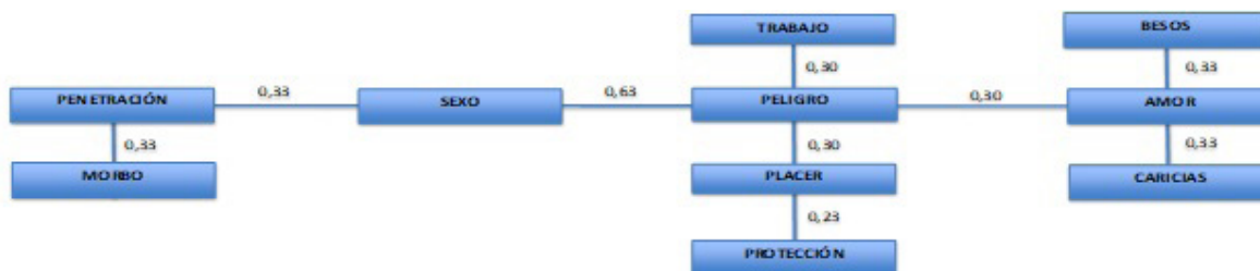
Figura 1. Índice de distancia del concepto relaciones sexuales en mujeres

En la segunda agrupación la palabra de mayor índice fue penetración, que se asoció con el morbo donde se expresa como la demostración de deseo para que se lleve a cabo en una relación sexual. De lo anterior se puede inferir que, para el grupo de mujeres transgénero, la representación de las relaciones sexuales es un peligro porque está ligada a las condiciones en las que han tenido que efectuarlas.