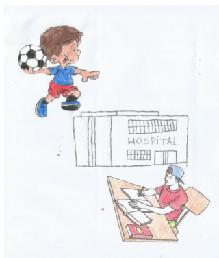
Figura 3. Desenho sobre afastamento das atividades cotidianas de Capitão América

Capitão América representou com seu desenho o afastamento das atividades cotidianas durante a hospitalização: