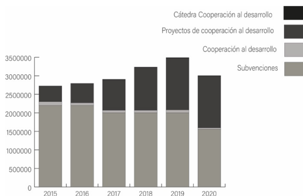
Gráfico 2. Evolución de las partidas presupuestarias destinadas a cooperación al desarrollo por parte del Ayuntamiento de Zaragoza