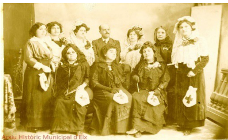
Figura 2. Junta de Damas de la ALCRE