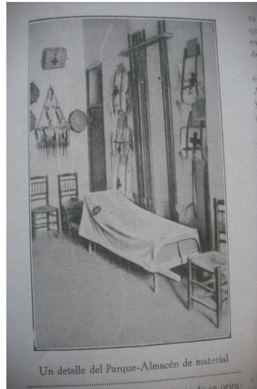
Figura 3. Detalle del Parque-Almacén de material.