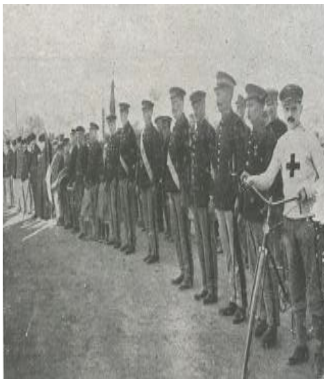
Figura 1. Brigada de Camilleros.