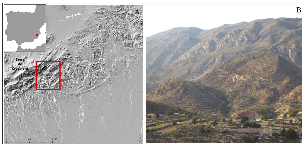
Fig. 1. Peña Negra. A. Localización del yacimiento. B. Vista de las elevaciones de la Peña Negra y El Castellar desde el sureste. Cartografía (A) S. Pernas.

Herna /Peña Negra se caracteriza por su emplazamiento estratégico, en un rico entorno paleoambiental, en el interior en la Sierra de Crevillent –aprovechando un cerro atravesado por varios barrancos que posee importantes colinas y relieves donde se desarrollaría un hábitat aterrazado–, con limitados y controlados pasos de acceso al lugar (Fig. 1).