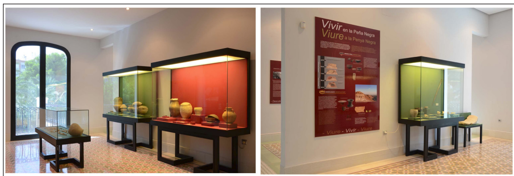
Fig. 4. Vista de las salas de la exposición temporal “Vida y Muerte en la Peña Negra”, abierta al público desde julio de 2015.

La labor divulgativa ha sido especialmente significativa en esta primera fase del proyecto, habiéndose desarrollado varias actuaciones transversales, entre las que destacamos la organización de una exposición monográfica en el Museo Arqueológico Municipal de Crevillent sobre Vida y Muerte en Peña Negra (Fig. 4), el desarrollo de Jornadas de Puertas Abiertas periódicas en el yacimiento, o las reuniones que desde 2015 vienen desarrollándose en Crevillent bajo el título genérico de “ La ciudad protohistórica de Herna/Peña Negra ”, dentro de la programación de los Cursos de Verano de la Universidad de Alicante, en la se han abordado diversas temáticas a partir de la documentación generada por Peña Negra, y que en 2018 alcanzará su cuarta edición. Por último, y dirigidas principalmente a la sociedad crevillentina, ha sido la publicación de los resultados de las excavaciones en las revistas de fiestas anuales (Lorrio y Trellis, 2016 y 2017; Lorrio et al. : 2018); la realización de jornadas de puertas abiertas y de visitas guiadas al yacimiento; la participación en eventos culturales y divulgativos como la celebración del Geología-Alicante 2018 en la Sierra de Crevillent, que ha incluido la visita al yacimiento de Peña Negra por más de 1.500 participantes; y la dinamización y divulgación del día a día del proyecto a través de las redes sociales (VV.AA., 2018).