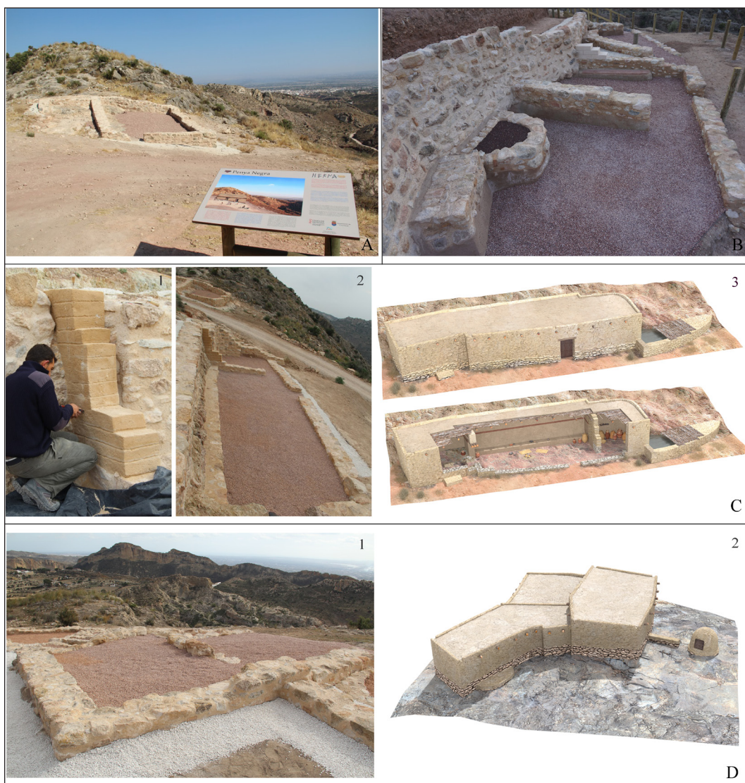
Fig. 3. Ejemplos de musealización del Parque arqueológico de Herna/ Peña Negra . A. Vista del edificio exento del Sector IIw tras su musealización y panel explicativo. B. Vista del barrio extramuros del Sector IB, tras su consolidación. C. Edificio singular tripartito del Sector IIw: 1. Proceso de consolidación de estructuras, 2. Vista del edificio tras su musealización. 3. Reconstrucción virtual. D. Edificio complejo del sector III: 1. Vista tras su consolidación y reconstrucción virtual del mismo.

Infografía: J. Quesada.