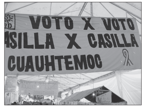
Plantones en el Zócalo.

Para concluir quisiera subrayar que la palabra clave de este texto es democracia .