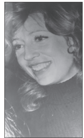
México álgido, las voces de la resistencia en la ciudad: La noche de Tlatelolco, Nada, nadie y Amanecer en el Zócalo