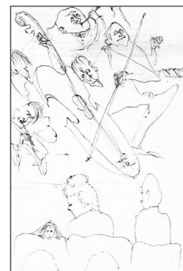
Lilus, Los músicos, por Eleonora Carrington.

Cada protagonista se relaciona con el poder patriarcal, que aparece en forma de una figura de alto significado cultural. Ninguna de ellas se desarrolla exclusivamente entre la gente común y corriente, sino que les toca asociarse a hombres excepcionales. Beloff y Modotti