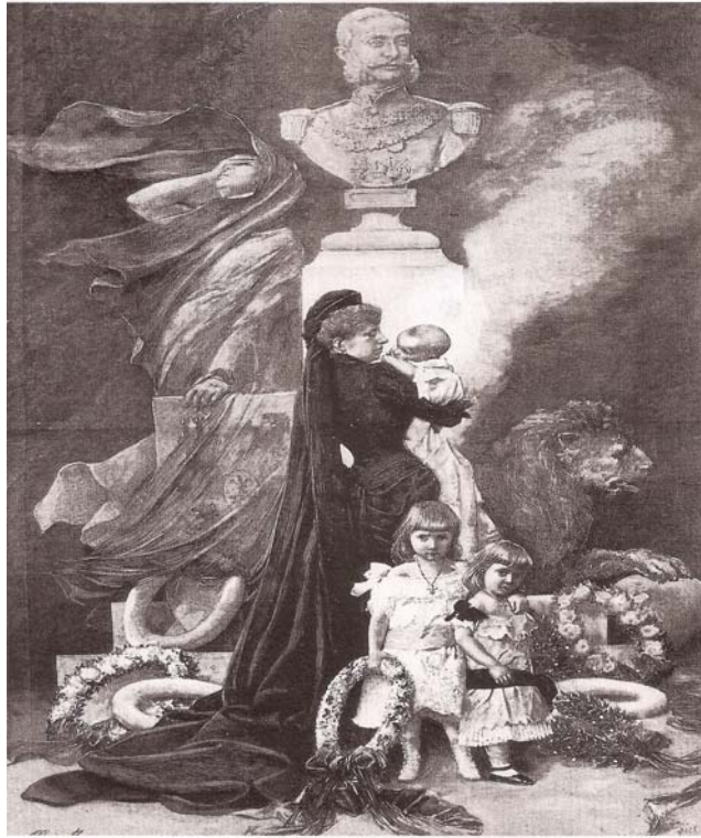
Ilustración 1. La regente María Cristina ofrece el bebé (Alfonso XIII) a una efigie de su padre, rodeada de sus hijas, que sostienen una corona fúnebre. Se representa a la viuda regente como nexo entre los reinados de Alfonso XII y Alfonso XIII. Grabado publicado en La Ilustración Española y Americana , 22-11-1886.