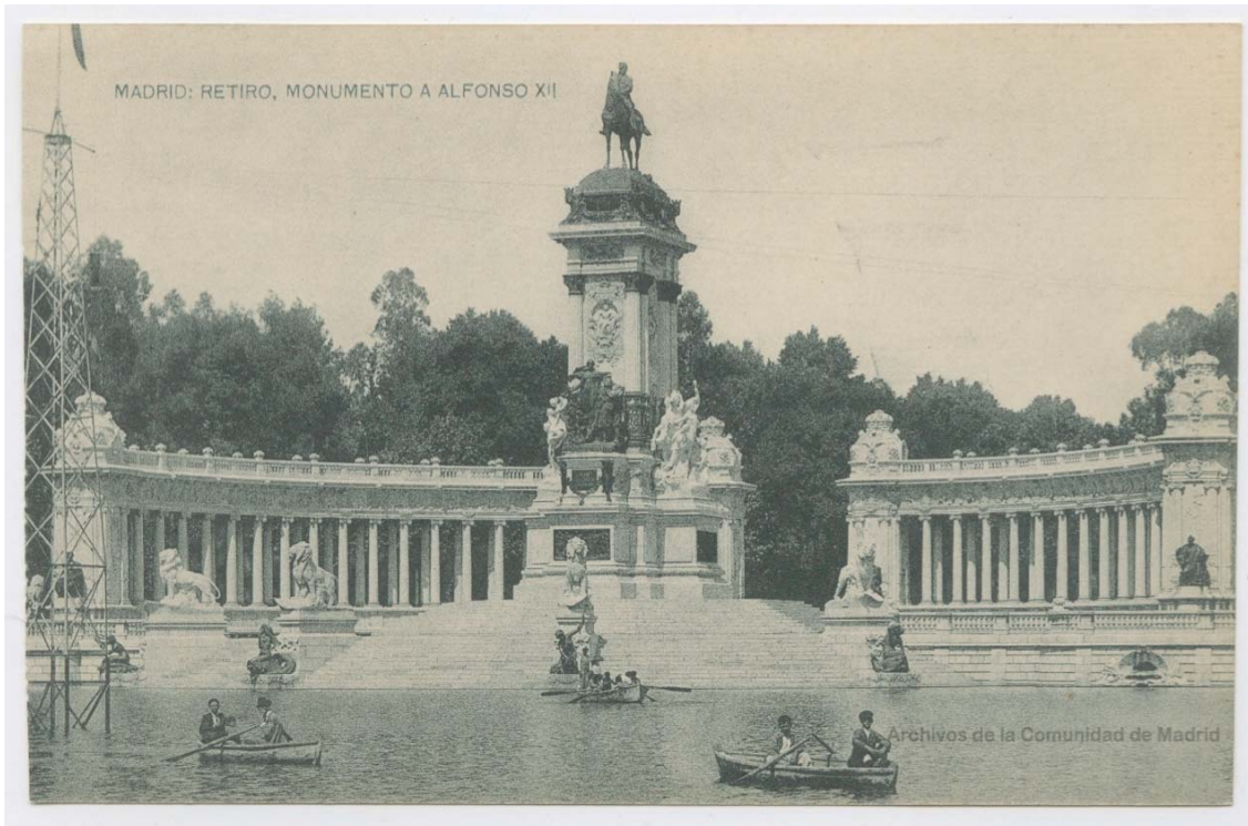
Ilustración 11. Postal con foto del Monumento a Alfonso XII tras su inauguración. En Biblioteca Digital memoriademadrid.