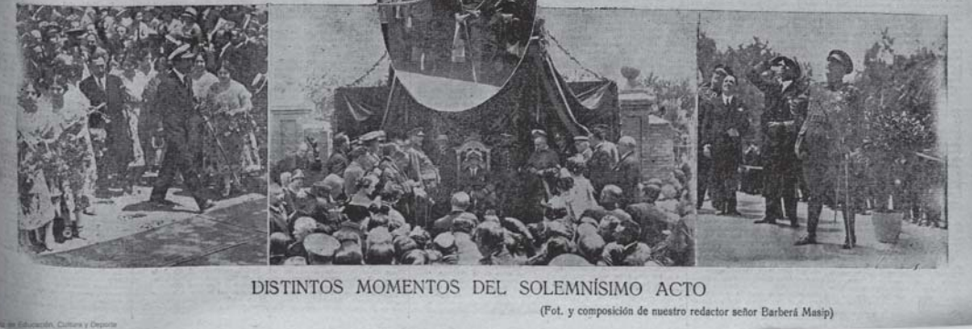
DISTINTOS MOMENTOS DEL SOLEMNÍSIMO ACTO