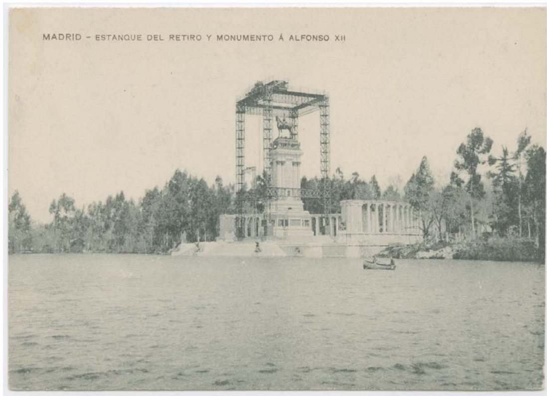
Ilustración 7. Postal con foto de la terminación de la parte arquitectónica (escalinata en abanico y hemicycle columnario) y de la colocación de la estatua ecuestre. 1909. En Biblioteca Digital memoriademadrid.