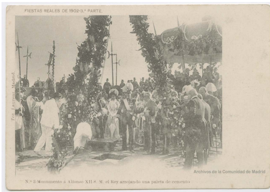
Ilustración 6. Postal con foto de Alfonso XIII echando la primera paleta de cemento sobre la primera piedra del Monumento en honor a su padre. Mayo de 1902. En Biblioteca Digital memoriademadrid.