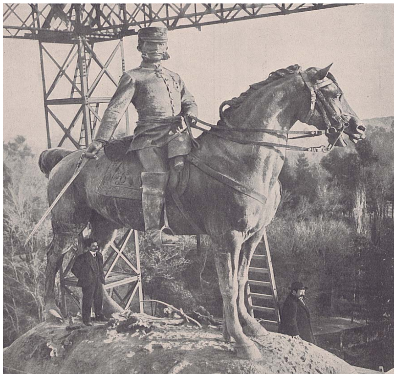
Ilustración 8. Foto de Mariano Benlliure supervisando los detalles de colocación de la estatua ecuestre de Alfonso XII, de unos 6 metros de altura. 1909. En Biblioteca Digital memoriademadrid.