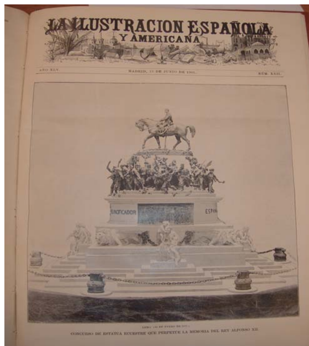
Ilustración 2. Uno de los proyectos (no el ganador) presentado al concurso público para erigir un monumento a Alfonso XII. Publicado en la portada de La Ilustración Española y Americana , 15-6-1901.