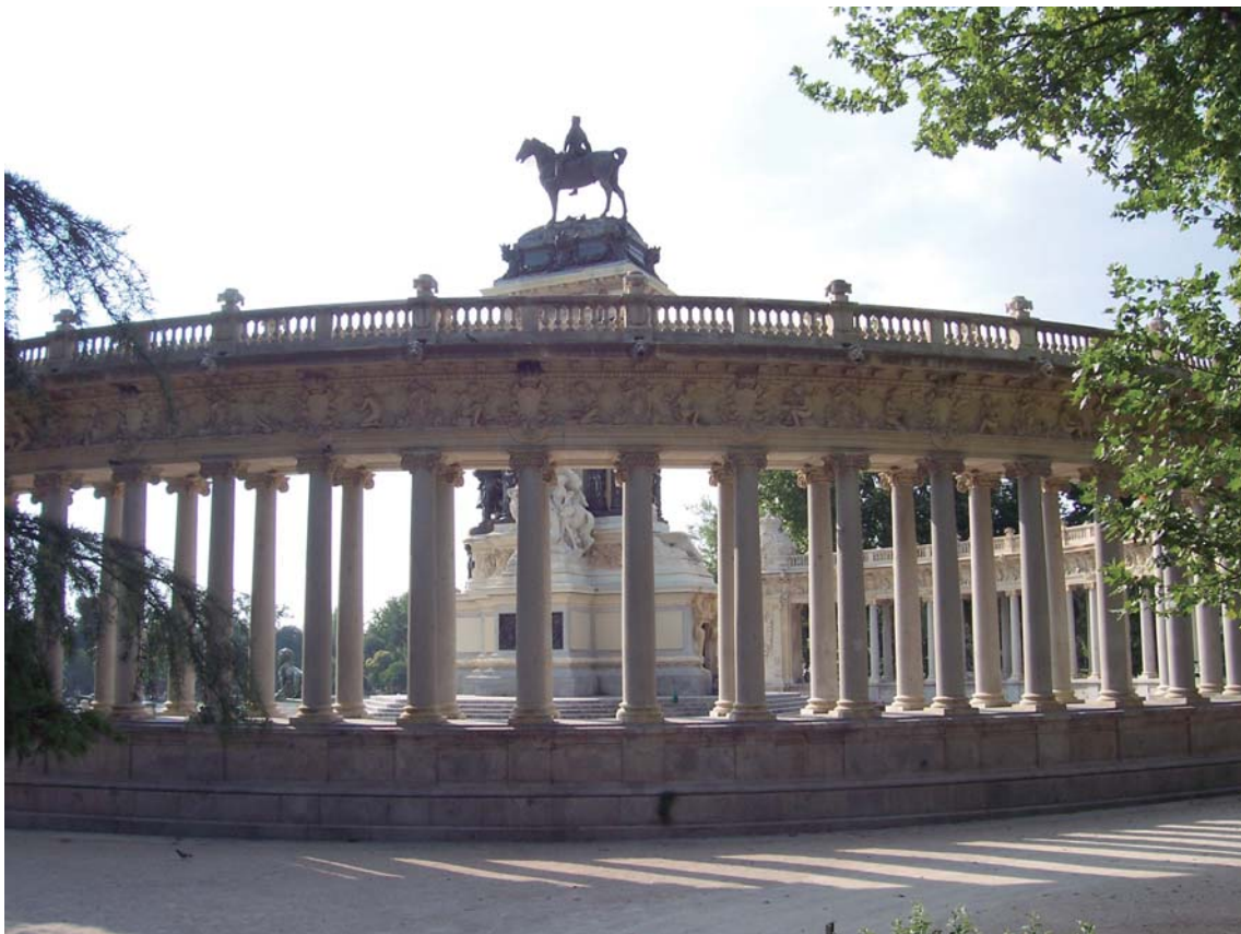
Ilustración 12. Detalle del hemiciclo con doble columnata, representación de las 49 provincias españolas, envolviendo, de forma simbólica, a la monarquía nacional.