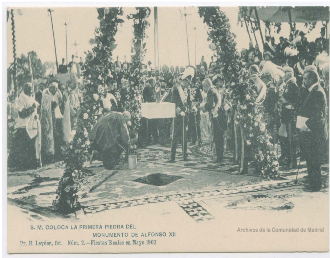
Ilustración 5. Postal con foto de la colocación de la primera piedra del Monumento a Alfonso XII , el día después de la coronación de Alfonso XIII. Mayo de 1902. En Biblioteca Digital memoriademadrid.