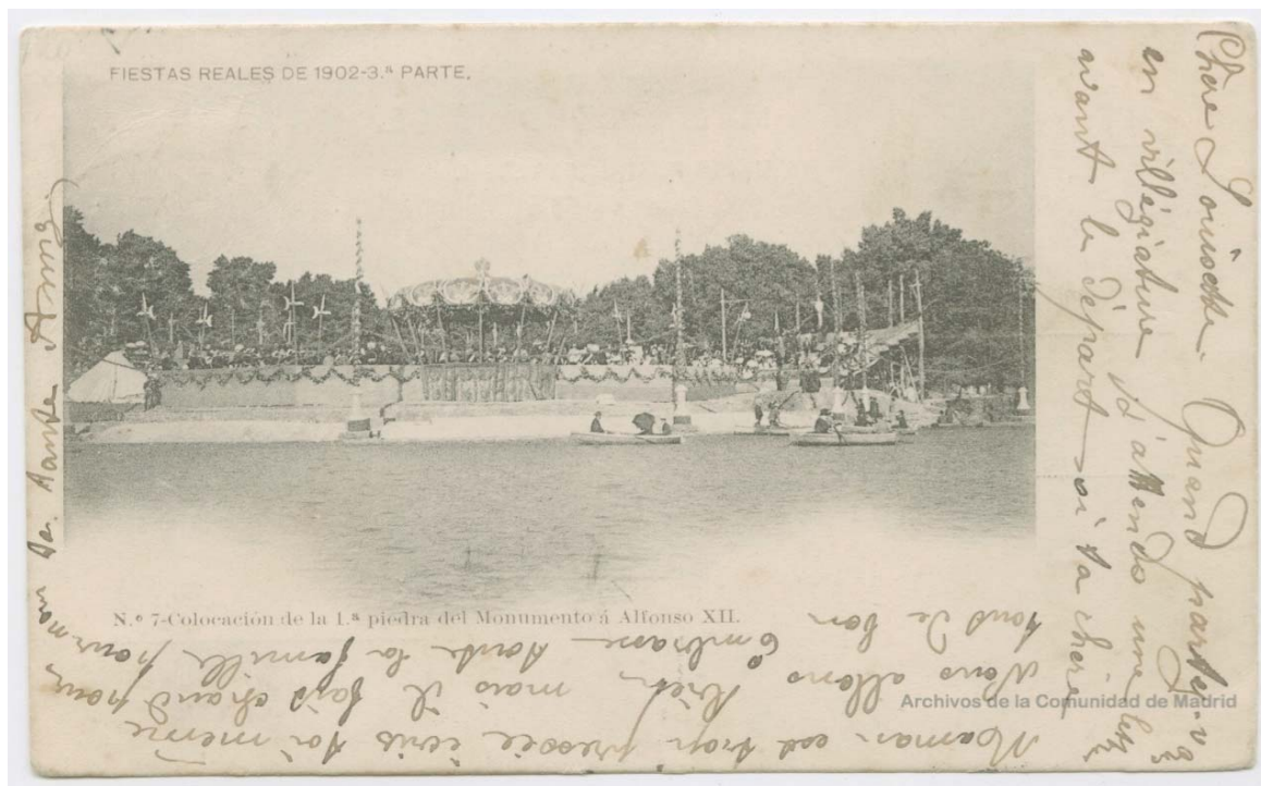
Ilustración 4. Postal circulada con foto de las fiestas reales en la zona del estanque del Retiro en honor a la coronación de Alfonso XIII. Mayo de 1902.