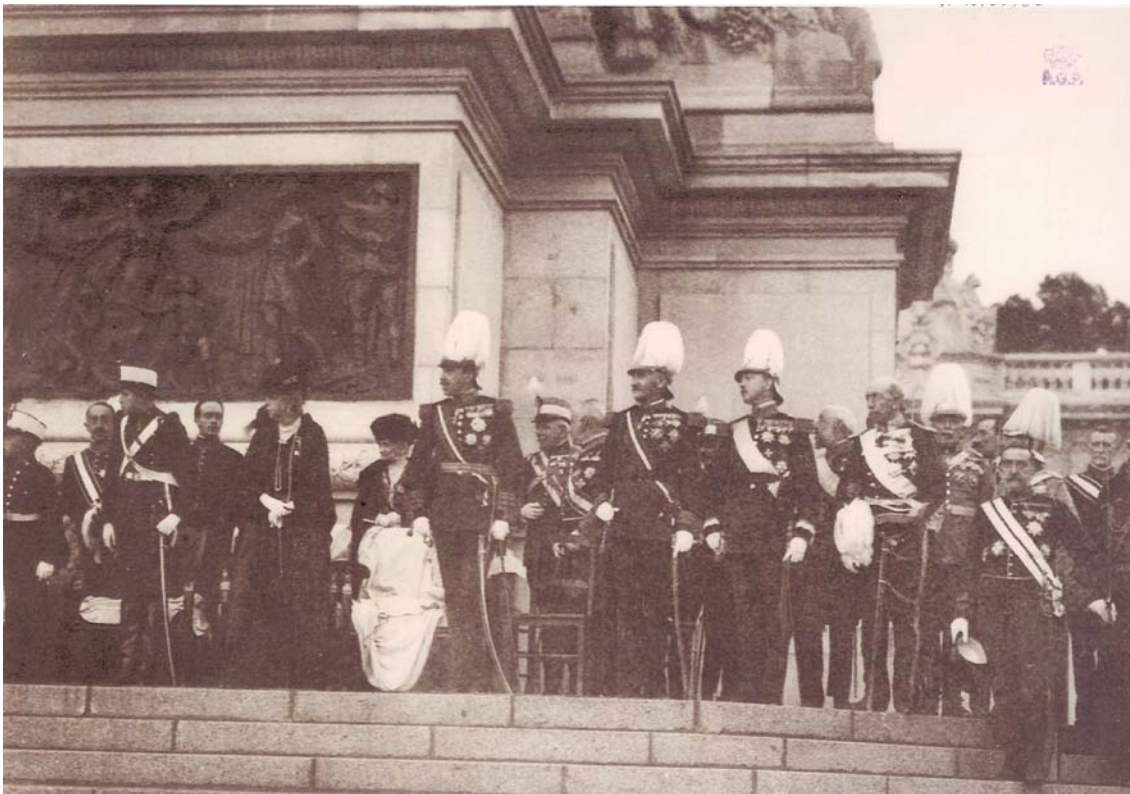
Ilustración 9. Ceremonia de inauguración oficial del Monumento a Alfonso XII . Presidida por Alfonso XIII. 3 de julio de 1922 . Archivo General de Palacio (Madrid), nº 10166563.