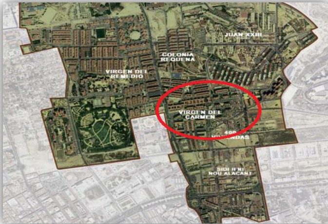
Figura 1. Visión aérea del barrio Virgen del Carmen