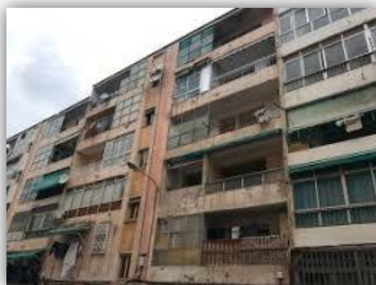
Figura 4 y 5. Visión a pie de calle de los edificios ubicados en el barrio "Virgen del Carmen"