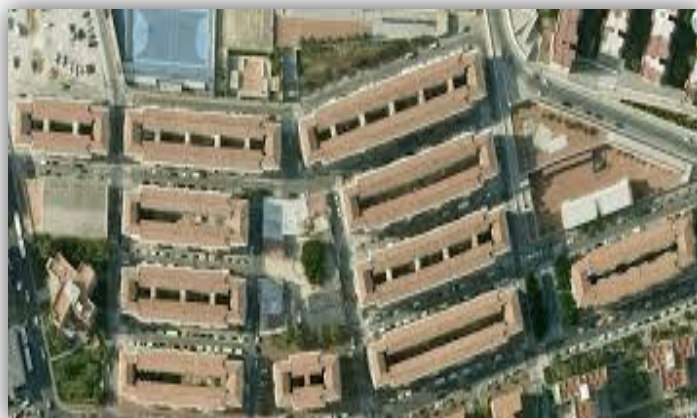
Figura 3. Visión aérea de la construcción del barrio "Virgen del Carmen, dividido en manzanas.

poseen conexión con el espacio urbano que le rodea. También se pueden apreciar muchos espacios de circulación confusa, multitud de rincones "ciegos" y zonas sin utilidad que son en su mayoría inservibles, dando esto lugar en el imaginario colectivo a todo tipo de motivaciones.