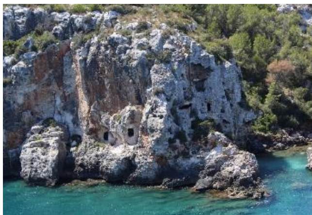
Figura 1. Vista de algunos hipogeos de la necrópolis de Cales Coves (Alaior).