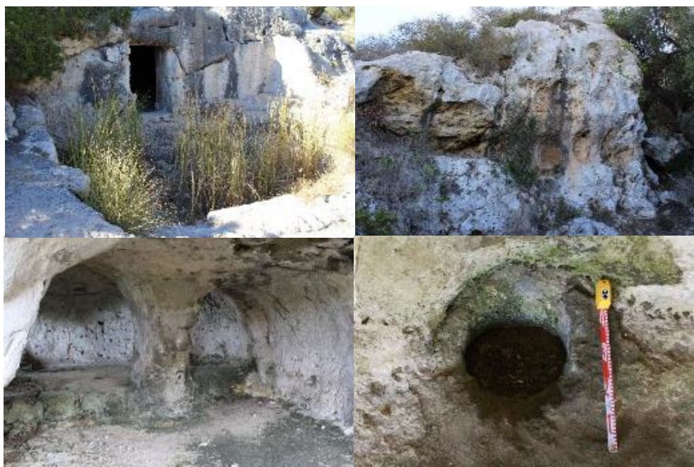
Figura 2. Algunos elementos característicos de los hipogeos de planta compleja: Patio del hipogeo 9 de Cala Morell (Ciutadella) (Arriba izq.), capades de moro de Na Carassa (Es Migjorn) (arriba dcha.), columna central de uno de los hipogeos de Torreta Saura (Ciutadella) (abajo izq.) cóc o pocito del hipogeo 3 de Cala Morell (Ciutadella) (abajo dcha.).