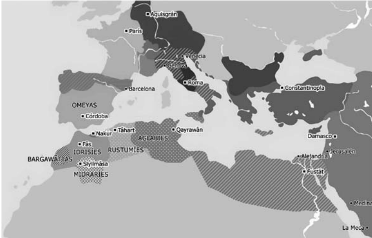
図1 9世紀末の西地中海

http://www.qantara-med.org/qantara4/public/show_carte.php?carte=carte-02 より作成。