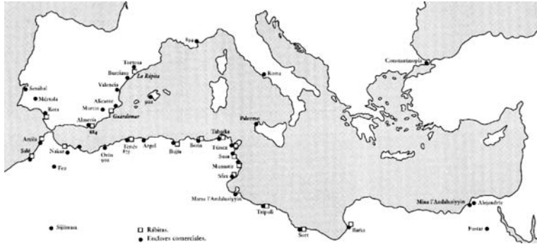
図6 9世紀末の地中海における城砦と商業拠点。P. Cressier, 2004 より。

ヤー、すなわち市の存在 いち 」を意味する (ibid., p.220) 54 )。いずれにせよ、市場と城砦は相伴うものであった (図6)。