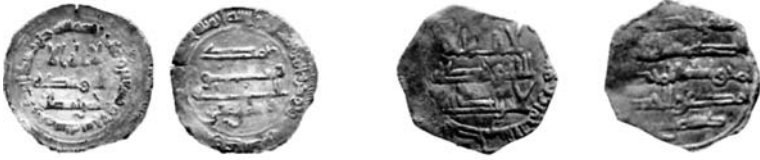
Peso: 1,3 g. Módulo: 20 mm Año 277 H./890-1 J.C..