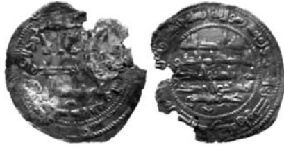
Peso: 2,05 g. Módulo: 28,5 mm. Año 293 H./905-6 J.C.