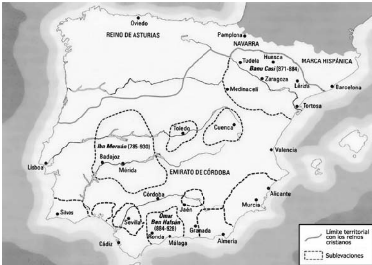
図3 アミール期末期の状況

9世紀後半、多くの領域が後ウマイヤ朝のアミールの支配から逃れ、在地の有力者の支配下に置かれていた（図3）。この事実と、またほとんど