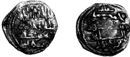
図5 イブン・バフルールの名があるファルス銅貨 表面・裏面とそれぞれの銘 glb . D. Francés y R. Rodríguez, 2010 より。

下にあり、 glb という修飾語句が加えられている (図5)。これらのアグラブ朝の銘を示す貨幣に加え、第2のタイプのイブン・バフルールと記された貨幣がある。こちらのファルス銅貨には、前者と異なり、造幣所と铸造された年が記されている。これらはアンダルスで铸造され、ヒジュラ暦 303・305・306年／西暦 915-919年のものが知られている 45) 。こちらではアグラブ朝への言及が無い。イブン・バフルールも両面ではなく、裏面の銘の後ろにのみ記されている。