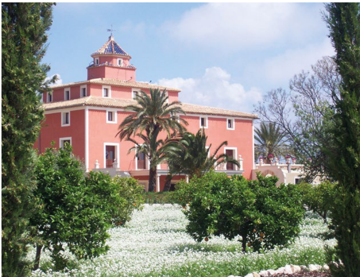
FIGURA 4. Vista general de la finca Marbeuf con los parterres plantados (2011).

reglas de composición, etc. La libertad ecléctica es, por tanto, un espejismo ya que, tras las columnas, los capiteles, las cornucopias y cualquier otro elemento tomado del pasado, se oculta una composición tradicional (Hernando Carrasco, 2004: 178).