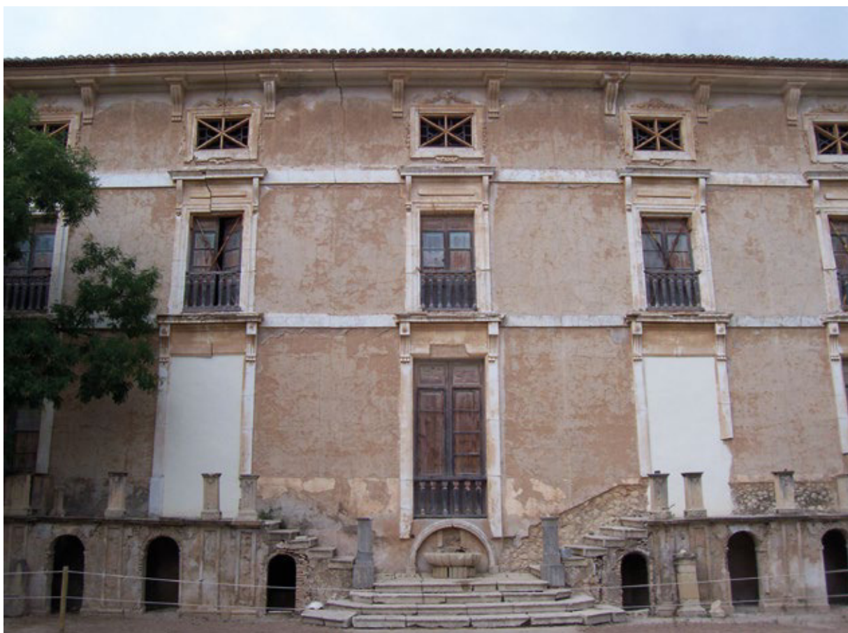
398 FIGURA 2. Fachada del palacio nuevo de Peñacerrada recayente al jardín (2012).

dormitorios; y ventanas rectangulares en la cambra «con rejas de hierro formando rombos y diagonales» (Varela, 1985, t. III: 525 y 1989, t. II: 292). Pero, es la fachada recayente «al jardín [la que] pretende ser ordenada, si bien todos los huecos están alineados coincidiendo en vertical, la alternativa entre huecos y macizos no es rigurosa, ya que estos últimos tienen anchos variables» (Varela, 1985, t. III: 523 y 1989, t. II: 290) (fig. 2). Además, destaca la finca El de Loreto por su acceso a la segunda vivienda desde el exterior mediante una escalera de dos tramos «de inspiración neoclásica, con un muy interesante antepecho de hierro forjado» (Varela, 1985, t. II: 278) (fig. 3); El de Sereix con sus aleros pintados en blanco y rojo, formando un damero; y, Subiela, ejemplo de composición simétrica en su fachada principal, orientada al sur, con acceso a la vivienda por medio de una escalera adosada de doble rampa sin olvidar el frontón ya mencionado sobre la puerta y la sillería vista con las esquinas almohadilladas. Además de estas residencias, observamos un grupo de edificaciones exentas con cubiertas a cuatro aguas y con lucernarios cúbicos para iluminar el espacio central de la vivienda y ventilar la escalera. En la mayoría de los casos, este lucernario es un perfecto mirador para observar