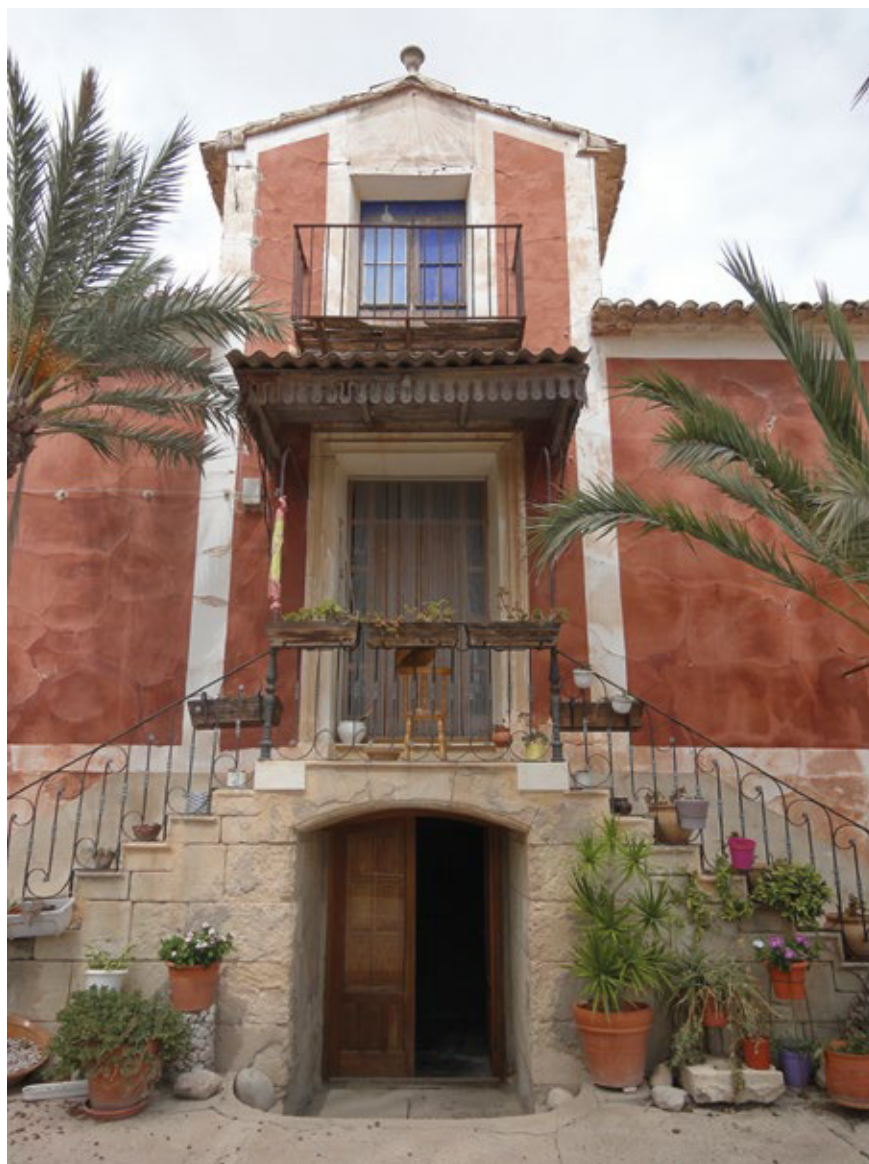
FIGURA 3. Escalera de dos tramos en la finca El de Loreto (2015) (Foto de la autora).

el entorno rural que rodean estas construcciones y también, es el reflejo del poder adquirido por estos nuevos propietarios como es el caso de Marbeuf, la única construcción de la huerta que tiene cinco alturas (Riquelme, 2016: 91-108) (fig. 4) y la torre central de planta octogonal de El Hort.