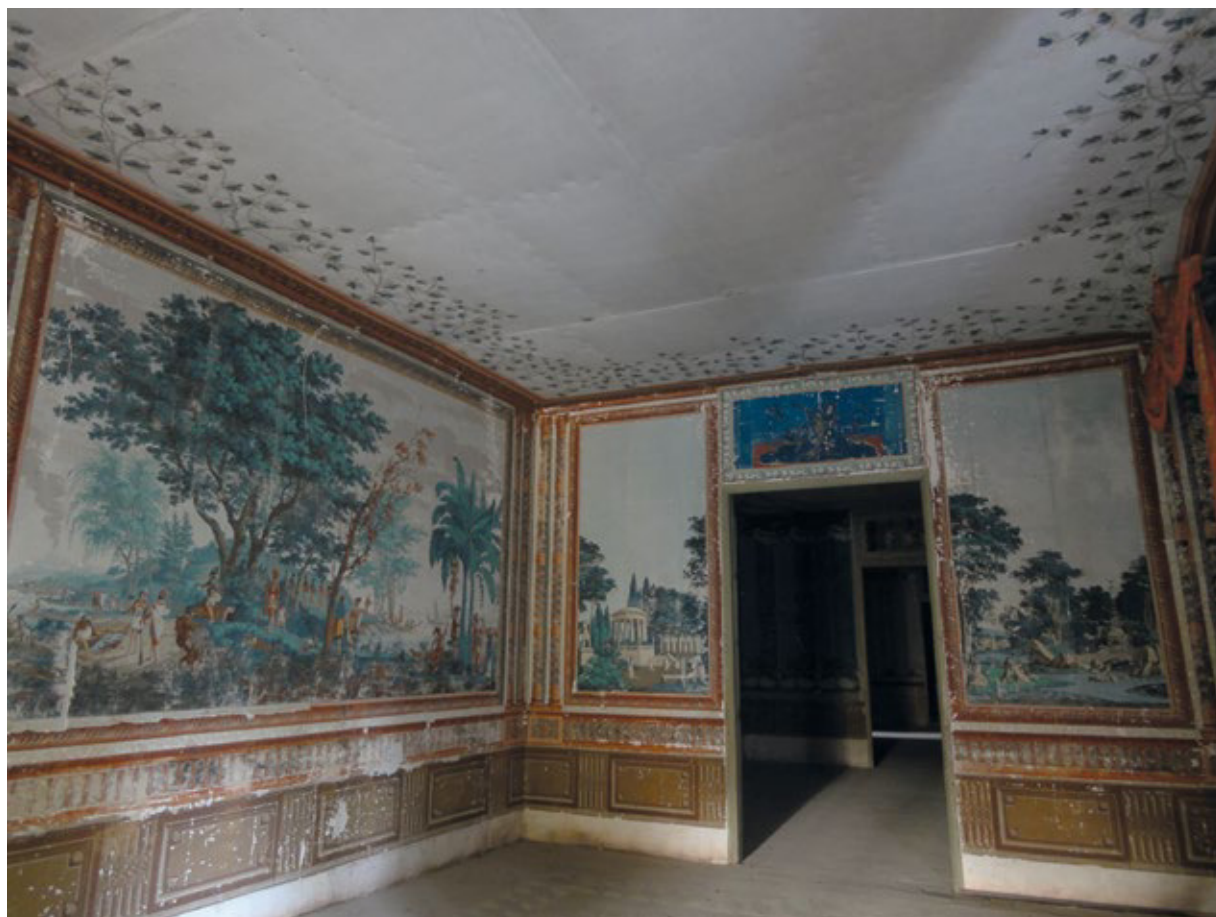
FIGURA 5. Enfilada de las estancias principales en el palacio nuevo de Peñacerrada (2016).

particulares y al boudoir o gabinete; así, observamos cómo el concepto de privacidad se va introduciendo (Simó, 1989: 103).