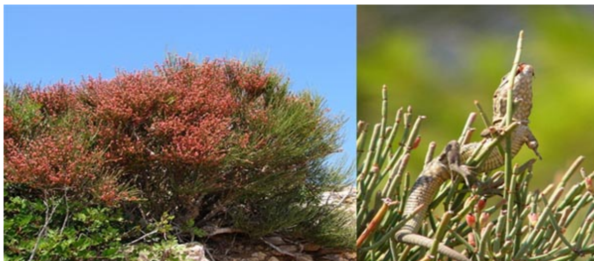
Figura 1. Individuo de Ephedra fragilis cargado de frutos en el islote de Sa Dragonera. Los frutos son activamente consumidos por lagartija balear ( Podarcis lilfordii ) (derecha).

Los reptiles son un importante dispersor de frutos carnosos en muchos ecosistemas insulares (Olesen y Valido, 2003), en los que muchas veces representan el principal dispersor de la flora nativa o endémica, hasta el punto de que su desaparición a consecuencia de la intervención humana puede llevar aparejada la extinción de dicha flora (Riera et al. , 2002; Traveset y Riera, 2005; Traveset y Santamaría, 2005). Incluso algunas especies comunes en áreas continentales dependen a veces de los reptiles para la dispersión en sus poblaciones insulares. Un ejemplo de esta relación se da con la efedra ( Ephedra fragilis ), un arbusto presente en áreas costeras y montañosas mediterráneas con frutos carnosos típicamente dispersados por aves en la península ibérica, pero que dependen principalmente de la dispersión por lagartija balear ( Podarcis lilfordii ) en algunas islas e islotes del archipiélago balear, como el Parque Natural de Sa Dragonera, en Mallorca ( Fig. 1 ).