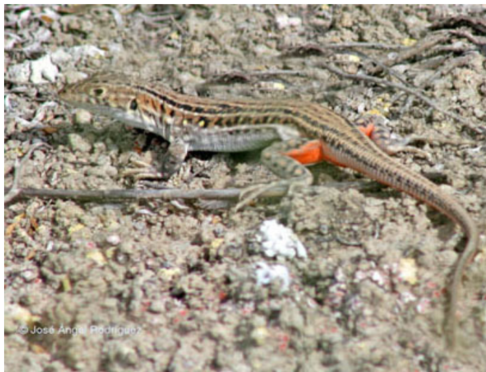
Figura 4. Coloración característica de la hembra en celo.