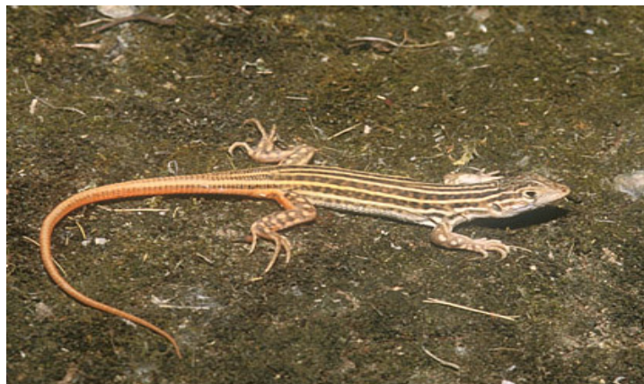
Figura 1. Juvenil de lagartija colirroja.

La lagartija colirroja, Acanthodactylus erythrurus Schinz 1833, pertenece a la familia Lacertidae. Es una lagartija de tamaño mediano y cuerpo robusto, que puede alcanzar 230 mm de longitud total y 80 mm de longitud cabeza-cuerpo (Seva, 1982; Carretero y Llorente, 1995a, 1995b). Debe su nombre a la coloración rojiza que presentan las colas de los jóvenes y de las hembras en celo ( Fig. 1 ). Sus miembros son fuertes, con dedos largos y uñas conspicuas. La cola posee escamas aquilladas, y está ensanchada en su base, especialmente en los machos en celo. El diseño dorsal es típicamente rayado, con bandas longitudinales ocráceas, pardas o grises separadas por líneas de tonalidades más claras en los adultos y alternando bandas claras y oscuras muy contrastantes en los juveniles (Salvador, 1981; Seva, 1982; Barbadillo, 1987; Carretero y Llorente, 1995a, 1995b; Pérez-Mellado, 1998).