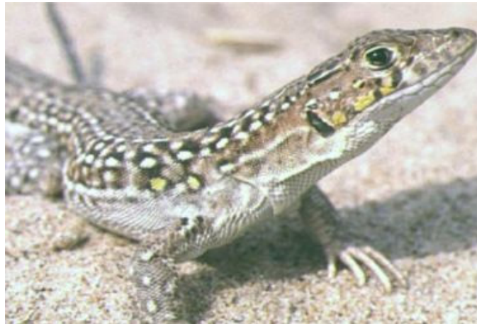
Figura 3. Detalle de los ocelos amarillos del macho en época reproductora.

Los individuos alcanzan la madurez sexual al año y medio de edad, coincidiendo con la segunda primavera, cuando los machos tienen un tamaño de 58-65 mm y las hembras 60-66 mm de longitud de cabeza y cuerpo (Seva, 1982, 1989; Bauwens y Díaz-Uriarte, 1997). El inicio del periodo de apareamiento viene marcado por la intensificación del color amarillo de los ocelos de los machos ( Fig. 3 ) y el color rojizo de los muslos y la cola de las hembras ( Fig. 4 ), al principio de la primavera. Pueden observarse cópulas entre los meses de marzo y julio, dependiendo de la zona (Seva, 1982; Busack y Klosterman, 1987). Las hembras realizan las puestas en huras que excavan en el sustrato, tras unos 20 días de gestación. Las puestas tienen lugar desde junio hasta agosto. El tamaño de puesta oscila entre 1 y 8 huevos, dependiendo del tamaño de la hembra, con una media de 4,4 huevos (Seva, 1982; Carretero, 1993; Carretero y Llorente, 1995c; Pérez-Quintero, 1996). Los recién nacidos miden entre 28 y 31 mm de longitud de cabeza y cuerpo, y pueden observarse desde mediados de junio hasta octubre (Seva, 1982; Barbadillo et al. , 1987; Seva, 1989; Pérez-Quintero, 1996).