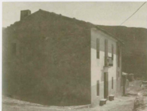
Casa Castalla, edifici principal en una imatge de 1905