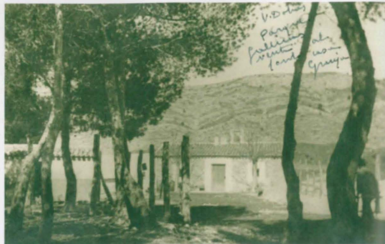
Casa del Pastor o de la Campaneta, junt a la pineda de l'era de la Casa Castalla