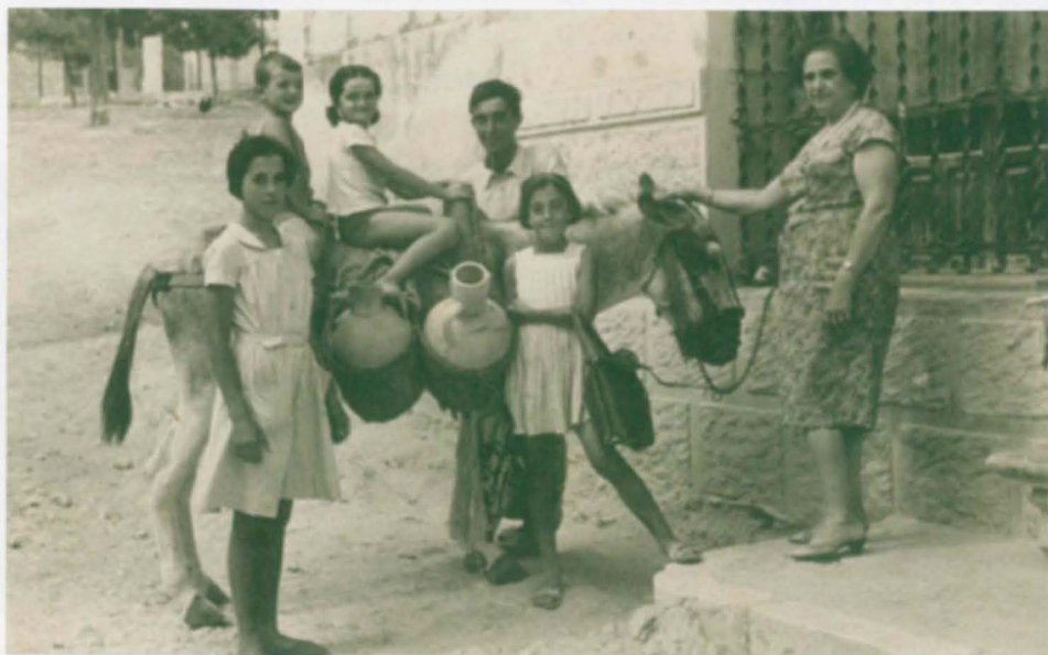
Grup de xiquets en la porta de la Casa Castalla carregant la mula per a anar a arregar aigua