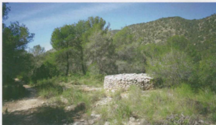
Conillera construïda en el lloc i a partir de les de la carbonera situada en el Puntal de la Senda de Castalla