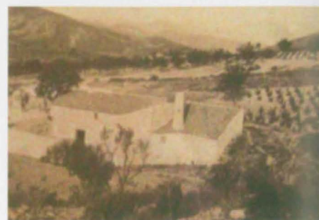
Casa del Bubo