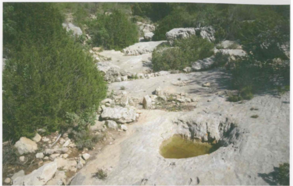
Cadolles de Ramón