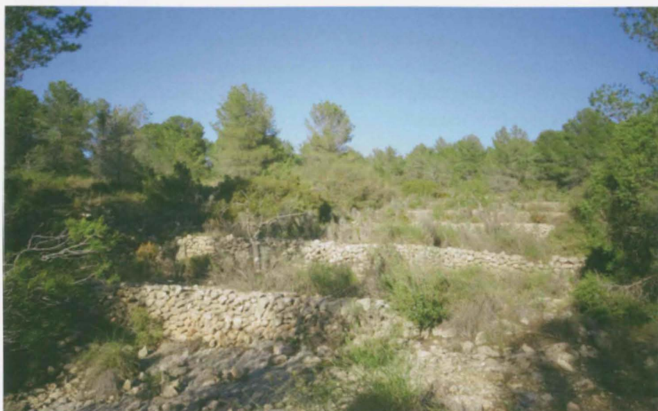
Canyaeta Galimperies o de Damunt del Pla Lloca

El paisatge rural que dibuixa Maria Payá, la de la Casa Castalla, és la suma i culminació de milers de treballs invisibles realitzats per persones humils i anònimes, paisatgistes involuntaris i involuntàries, que van donar sentit de lloc i van batejar un territori profundament assimilat i transformat. El