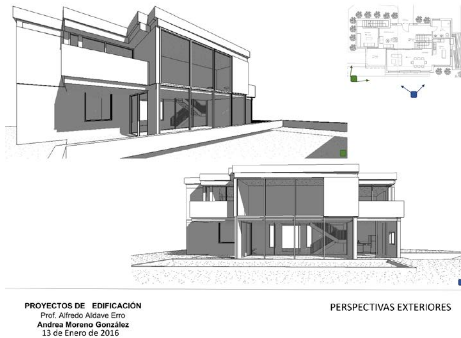
Imagen 4. Práctica de Proyectos de Edificación