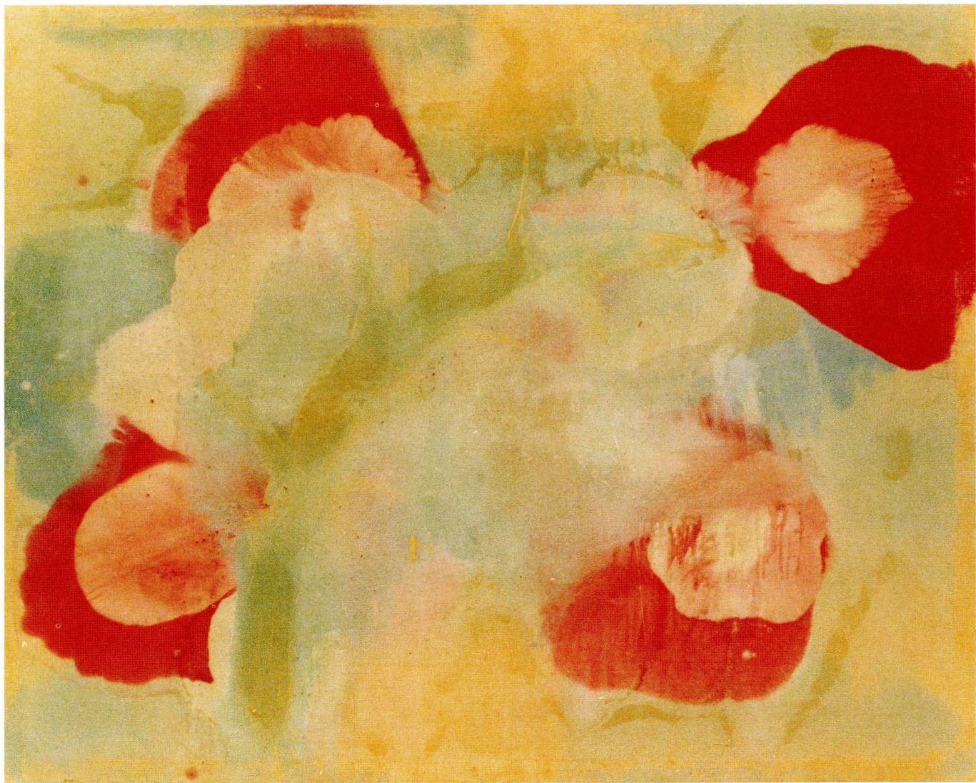
□ ÓLEO SOBRE TELA, 160x200 cms.