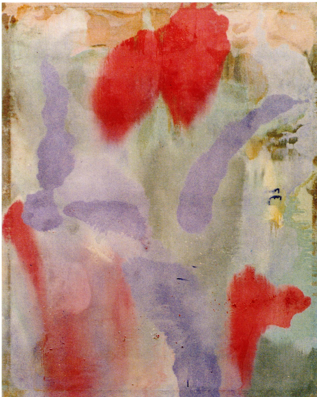
□ ÓLEO SOBRE TELA, 200x160 cms.