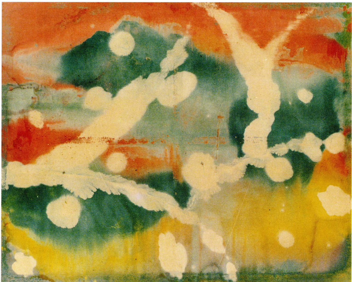
□ ÓLEO SOBRE TELA, 160×200 cms.