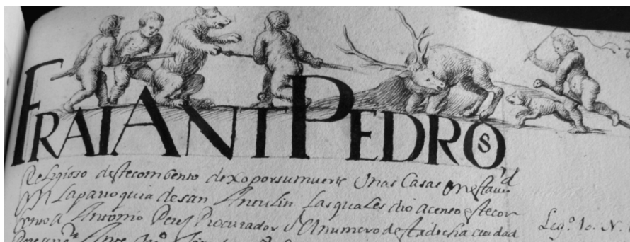
Lámina II. Libro Becerro de Trinitarios, fol. 89r. Incipit tipo A