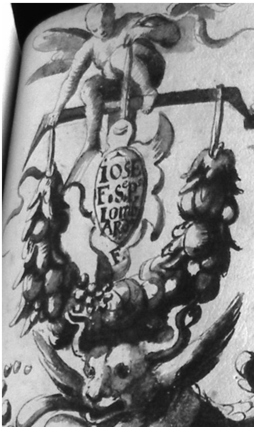
Lámina VIII. Libro Becerro de Trinitarios , fol.126r (detalle)

que pertenece dicho Becerro. Aunque no aparece inscrito de forma expresa su nombre, como en el caso anterior, es notoria su autoría en la inscripción de la cartela que aparece en la decoración del incipit del folio 135 recto de dicho Becerro, en la parte inferior derecha, que detalla: IO SOY V s (Villaçis) 13 .