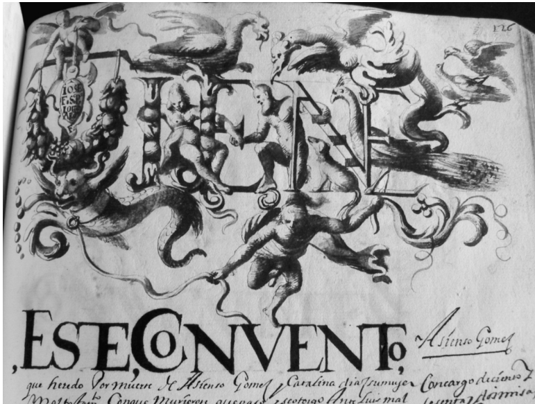
Lámina VII. Libro Becerro de Trinitarios, fol.126r

IOSEPH/ F(ater) Se(ra)P(hicus) LOmb/ARdo // F(ecit). Ambas pueden ser válidas pero la segunda de ellas, a pesar de lo incorrecto de la transcripción y desarrollo de las formas abreviadas, en caracteres capitales con letra sobrepuesta e interpuntuadas, me parece la más apropiada, ya que el calificativo de «seraphicus» (análogo al término «angel») precedido del sustantivo «frater» se emplea desde el siglo XVII para designar a la orden franciscana o con el valor propio de la expresión «hermano angelical». Y si a ello se asocian los elementos figurativos externos que acompañan y forman parte de la cartela en que se inscribe dicha inscripción, se observa como aparece la figura de un ángel que sostiene en su mano siniestra la misma 11 . Así pues, vislumbra que Fray Joseph, seraphicus, originario de la región italiana de la Lombardía, fue uno de los iluminadores del Becerro Trinitario murciano.