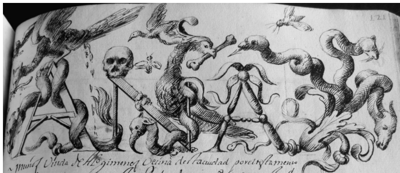
Lámina IV. Libro Becerro de Trinitarios , fol. 121r. Incipit tipo B

zado gráfico-escriturario y decoración pictórica se ejecutan al mismo tiempo y por la misma mano, por lo que escriba e iluminador son una sola persona. La técnica decorativa es el dibujo a plumilla matizado, de clara influencia barroco-italiana 9 . Aparecen de forma casi continua desde el folio 104 al folio 152 de dicho Becerro .