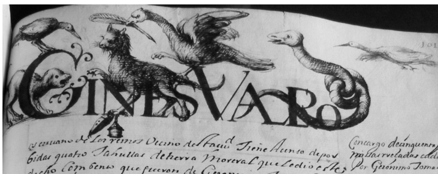
Lámina III. Libro Becerro de Trinitarios, fol. 101r. Incipit tipo A

la decoración pictórica fue realizada sobre los epígrafes con posterioridad a la realización de estos, de ahí que los elementos pictóricos se adapten al trazado y morfología de las letras. La técnica decorativa es el dibujo a plumilla monocromo. Aparecen en los folios del 1 al 101 del Becerro.