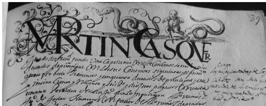
Lámina I. Libro Becerro de Trinitarios, fol. 39r. Incipit tipo A

Los incipit A , en los que presenta una inicial capital, de módulo variable, ornamentada en la mayoría de los casos, con una decoración externa adaptada a la forma y trazado de las letras. Dada su disminuida artificiosidad gráfico-pictórica, su morfología y módulo, en relación a los incipit del tipo B, los consideramos semi-solenmes o menores. Utiliza dos tintas, generalmente, negra para el trazado y relleno de las letras y ocre para la decoración externa, ocupando entre 2 y 3 unidades de pautado. En el proceso de ejecución de éstas, primeramente se delineaban las letras y después se procedía a su relleno con tinta, similar a la práctica epigráfica. La letra es de morfología capital, con los remates triangulares característicos; presentando letras encajadas y nexadas, fruto de la falta de espacio en el espacio reservado para la escrituración del tituli . La decoración de éstos es emplazada con posterioridad al trazado y ejecución de la letra, por lo que se aprecia la presencia de dos manos, la del escriba y la del iluminador, en diferentes espacios de tiempo. Es decir,