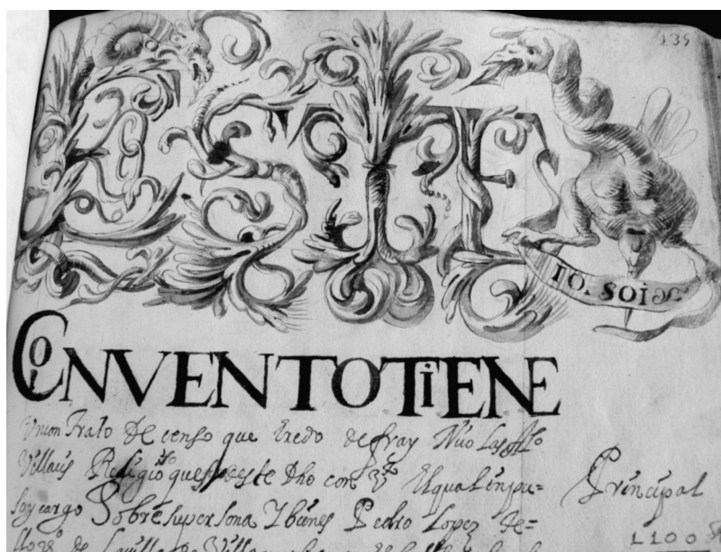
Lámina IX: Libro Becerro de Trinitarios, fol.135r

Todo el programa iconográfico y gráfico lo ejecutan cenobitas de las órdenes mercedaria y franciscana, en cuya práctica se advierte no sólo el deseo de servir a Dios con su trabajo, sino el propósito publicitario de magnificar la importancia del Becerro e indirectamente dejar constancia de la obra realizada en favor de sus protagonistas.