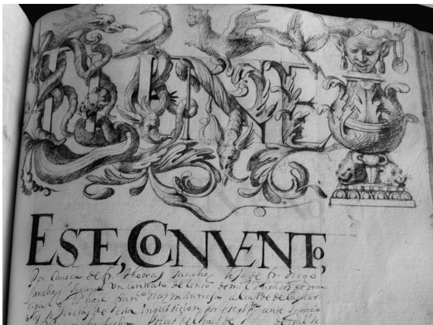
Lámina VI. Libro Becerro de Trinitarios, fol.137r. Incipit tipo B

Tanto los del tipo A como los del tipo B, presentan un programa iconográfico diverso, siendo más nutrido el repertorio decorativo que se presenta en los tipos B: representación de elementos animados de tipo grotesco, quiméricos y fantásticos, junto a figuras humanas, motivos florales, navales y heráldicos. Cuya iconografía guarda, en ocasiones, una estrecha relación bien con el asunto que se escritura a continuación, o bien con los mecenas que contribuyen a la hechura del Becerro y con la orden religiosa que lo produce y maneja: los Mercedarios. A tenor de lo cual se puede constatar la importancia de la decoración en estos letreros, no solo en el aspecto llamativo o publicitario escriturario que encierran, sino en el mensaje subliminal que arrojan en torno a aspectos concretos de finalidad, propiedad, ubicación y mecenazgo.