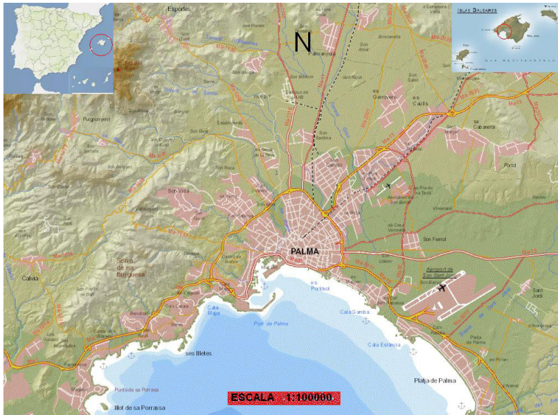
Figura 1. Palma de Mallorca y su localización en la isla.

de eventos se puedan clasificar como inundaciones de carácter local y anegamientos de tierras (Grimalt y Rosselló, 2011). El desarrollo urbanístico en la zona costera ayuda también al incremento de sucesos que se pueden relacionar además con otros factores como la topografía de las zonas afectadas, la falta de adecuación del alcantarillado y por las intensidades de precipitación causantes de los hechos. Los problemas ocasionados por las aguas son básicamente la inundación de plantas bajas y subterráneos así como problemas de tránsito por el corte de calles y pasos inferiores (Grimalt, 1992).