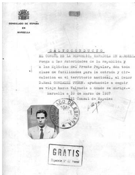
Salvoconducto (España, 1937) [Archivo Nélida Rodríguez Marqués].

15 El poema, que luego sería titulado genéricamente «La libertaria», había aparecido en la revista Milicia popular (Madrid, año I, núm. 63, 7 de octubre de 1936, p. 2), en un número conmemorativo del alzamiento minero de Asturias.