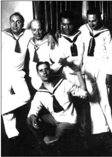
Neruda, Lorca y González Tuñón en Buenos Aires (1933).

3 Pablo Neruda, Confieso que he vivido , Madrid, Unidad Editorial, 1999, p. 119.