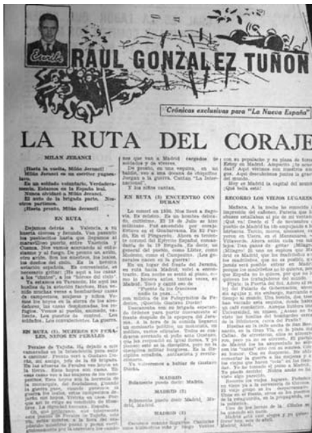
Crónicas de González Tuñón sobre la Guerra Civil Española.