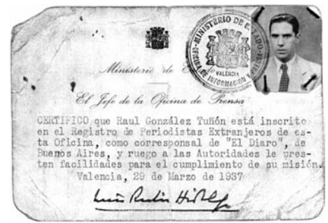
Carnet de periodista de González Tuñón (España, 1937).

Quizás muchos retrocederán ante su repugnancia frente a lo que llaman política –dice en su ponencia Henri Barbusse–. No dejemos deformar el sentido de la palabra política con el pretexto de que los políticos que nos dirigen son unos fantoches o gente deshonesto. [...] El verdadero sentido de la palabra política, es: realización social. Todo progreso social es un producto político... 14 .