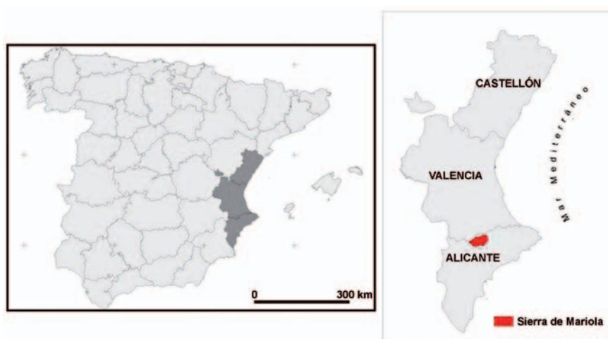
Figura 1. Mapa de localización de la sierra de Mariola.

La sierra de Mariola es una formación montañosa situada al sureste de la península Ibérica (figura 1), concretamente, en la Comunidad Valenciana. Este relieve es, a la vez, frontera y nexo de las comarcas de L'Alcoià, la Vall d'Albaida y El Comtat, y abarca una superficie total superior a 17.500 hectáreas, lo que lo convierte en uno de los parques naturales más extensos de la Comunidad Valenciana. Con un clima típicamente mediterráneo, con temperaturas suaves, lluvias concentradas en primavera y otoño y un destacado periodo seco en verano, las temperaturas medias anuales oscilan entre los 13 y los 16 °C. La vegetación climática es