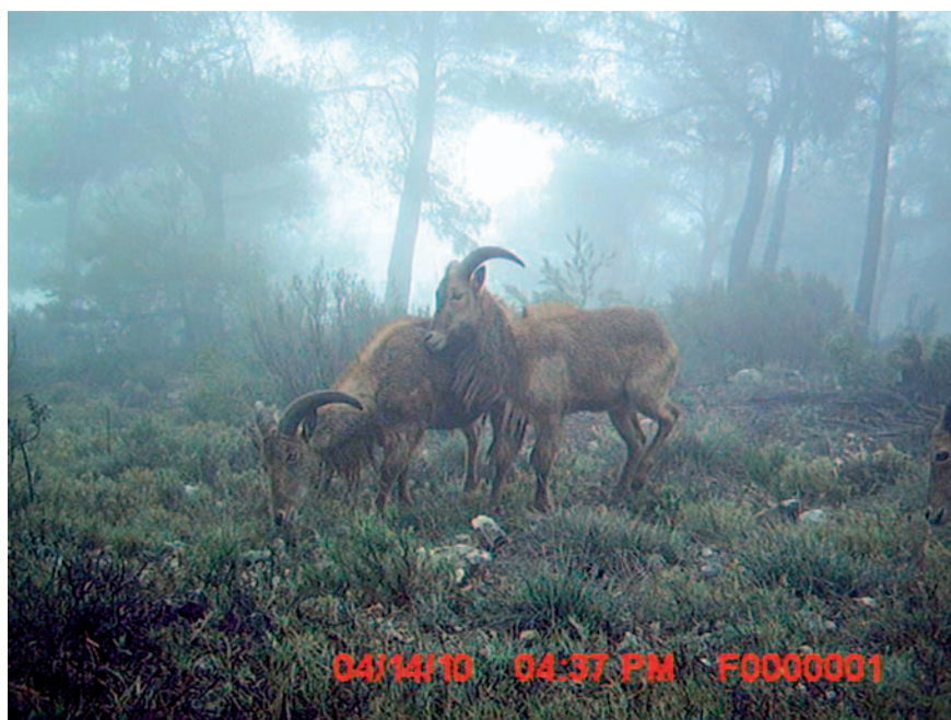
Figura 2. Detalle del arruí ( Ammotragus lervia ) mediante trampeo fotográfico.

La metodología empleada para determinar la expansión del arruí, por el tercio norte de la provincia de Alicante y sur de la de Valencia, se ha basado en la técnica conocida como fototrampeo. El trampeo fotográfico es una práctica no invasiva utilizada en diversas áreas de conocimiento, como la investigación de la fauna silvestre, la gestión de especies de caza, el control de especies o la educación ambiental. Esta es una actividad en auge debido a la reciente incorporación y el abaratamiento de diversas tecnologías aplicadas a equipos fotográficos automatizados (p. ej.: los sensores de movimiento, las cámaras digitales, las tarjetas de memoria compacta, los flashes de infrarrojos o las baterías de larga duración). Estos equipos autónomos pueden ser colocados en lugares remotos durante varias semanas, incluso meses, sin tener que realizar mantenimiento alguno, por lo que se configuran como un recurso para la investigación de incomparable utilidad. En la figura 2, se puede ver un ejemplo de imagen tomada con cámaras de fototrampeo (Belda et al., 2009).