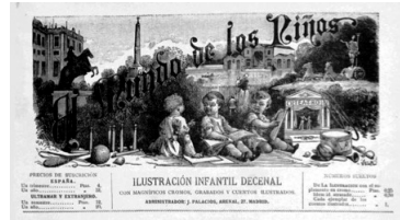
Imagen 2: Detalle cabecera de El mundo de los niños

madrileña en el que tres infantes parecen conversar frente a un teatrillo de guiñol, entre libros, cuadernos y juegos infantiles: