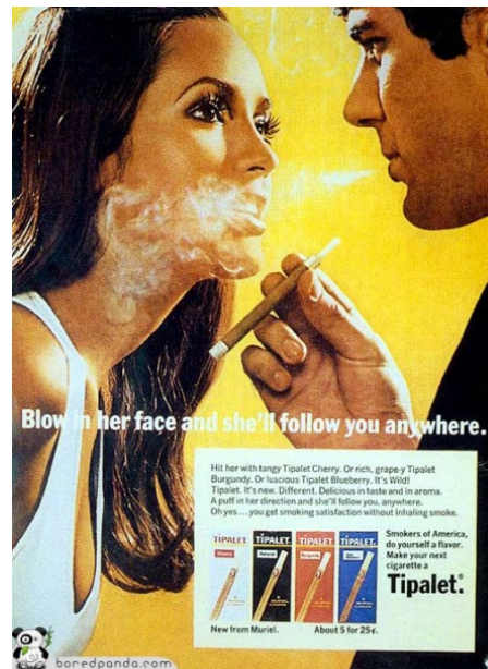
Figura 6. Campaña de cigarrillos Tipalet y su particular manera de entender la persuasión publicitaria, bajo la posible explicación de los diferentes sabores de tabaco de la marca: cereza, arándano y uva, entre otros (años 60)

Un parámetro de vital importancia a considerar al analizar la figura del prescriptor publicitario es apostar por una verdadera y creíble relación en primera instancia entre el producto y el propio famoso. Solamente si ese vínculo es sostenible, veraz y suficientemente sólido se podrá fijar una relación biunívoca, de mutua influencia, que trascenderá al universo social para, a su vez, influenciar en el receptor, llamémosle a éste público objetivo, usuario o simplemente consumidor. En la historia de la comunicación publicitaria encontramos casos palmarios de intentos de relación frustrada, como la compañía farmacéutica americana de analgésicos Datril, que tras un proceso de negociación arduo, acabó convenciendo al agente del actor John Wayne para que éste le prestara su imagen. Acostumbrado el público a las proezas de Wayne y a su particular forma de abordar el peligro, no resultó del todo creíble su manera de pelear contra el dolor de cabeza, no favoreciéndose el proceso inconsciente de transferencia, identificación e influencia necesarios para, en este caso, activar las ventas.