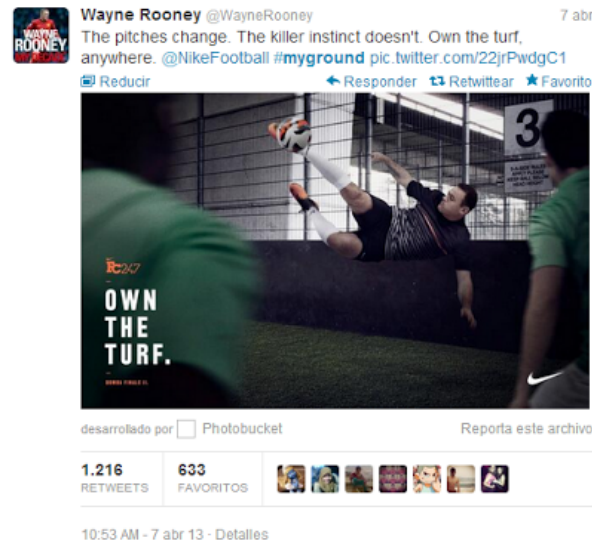
Figura 11. Tuit de Wayne Rooney para campaña de @NikeFootball

En España, uno de los casos más polémicos, que provocó el malestar entre usuarios que tacharon los mensajes de publicidad encubierta por su escasa sutileza y nula credibilidad, es el de Danone. En julio de 2013, varios famosos españoles –Nuria Roca, Carolina Cerezuela, Jesús Vázquez o Santi Millán, entre otros– publicaron en sus perfiles de Twitter un mensaje con la etiqueta #porfincalor. Lo que parecía ser un simple mensaje personal publicado libre y voluntariamente, ya que no se indicaba que fuera un tuit patrocinado, resultó formar parte de una campaña de Danone para el lanzamiento de su nuevo producto Yolado. Carolina Cerezuela fue la única que integró el hashtag #publi dentro de su mensaje.