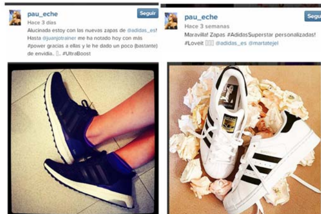
Figura 3. Publicaciones de la actriz y bloguera Paula Echevarria en Instagram sobre productos Adidas

Un ejemplo de esta tendencia a asociar marcas con líderes de opinión o personajes conocidos públicamente a través de espacios de la Web 2.0 es el fenómeno de las blogueras de moda, que constantemente aconsejan en sus blogs y espacios en redes sociales productos de marcas que se los prestan o regalan buscando lograr gracias a sus audiencias máxima visibilidad con mínima inversión. Estas “it girls”, a quienes se les presupone independencia y credibilidad, se han convertido en nuevas prescriptoras imprescindibles para la estrategia de marketing de cualquier marca de moda, llegando a cobrar hasta 450 euros por tuit y 12.000 euros por amadrinar un evento 4 .