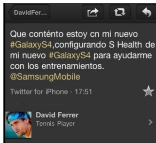
Figura 7. Tuit de David Ferrer sobre el móvil Samsung Galaxy S4

Otro notorio caso de marketing de influencia relacionado con una figura relevante o celebrity, en este caso también un deportista, fue el protagonizado por el tenista David Ferrer y Samsung Galaxy 4. Aprovechando su participación en el Mutua Madrid Open 2014, patrocinado por la empresa surcoreana, Ferrer lanzaba un tuit en su perfil de la red social que contenía el siguiente mensaje: