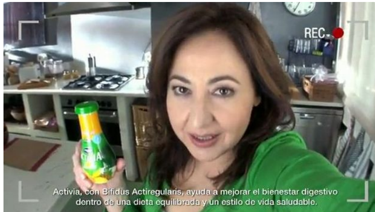
Figura 1. La actriz Carmen Machi anunciando Activia de Danone

Como sostienen Agrawal y Kamakura (1995, p. 56), el uso de las celebridades en comunicación incrementa la credibilidad de los mensajes, aumenta el recuerdo y el reconocimiento de las marcas anunciadas, mejora la actitud hacia la organización que vende el producto, e incluso incrementa la probabilidad de compra.