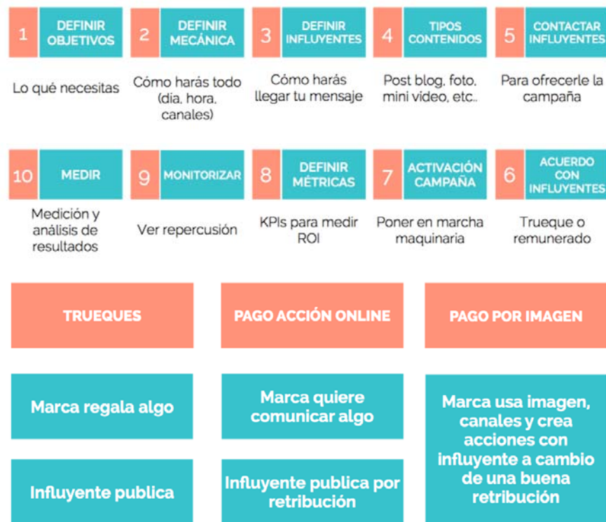
Figura 8. Estrategia de marketing de influencia según Vilma Núñez 15

Una de las premisas para que el marketing de influencia resulte efectivo es crear contenidos en los que la imaginación sea un componente relevante y la distribución del contenidos se lleve a cabo de manera diferente, con una estrategia premeditada, reposada, y con una planificación en donde se pueda prever –dentro de lo posible, habida cuenta de que por la propia naturaleza de las redes sociales los efectos en éstas son, en la mayoría de las ocasiones, poco previsibles- dedicación, cálculo de consecuencias y efectos del feedback. En este sentido, Núñez sintetiza la estrategia del marketing de influencia de la siguiente manera: