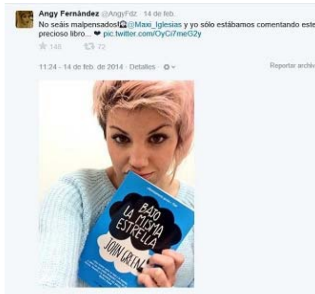
Figura 9. Tuit de @angyFdz sobre la novela “Bajo la misma estrella”

Al albur de estos datos y ejemplos, resulta evidente que la comunicación en general y la publicidad de forma concreta, toma nuevas formas en la era de las redes sociales. Tomando como referencia el ejemplo anterior, en cualquier otro momento estos dos actores habrían protagonizado un spot publicitario para ser emitido en horario de máxima audiencia en todas las cadenas de televisión. Sin embargo, el marketing de influencia permite segmentar, llegar a los seguidores de ambos y dirigir la conversación sobre el objetivo, construyendo para ello un discurso exento de la agresividad comercial propia de la publicidad convencional.