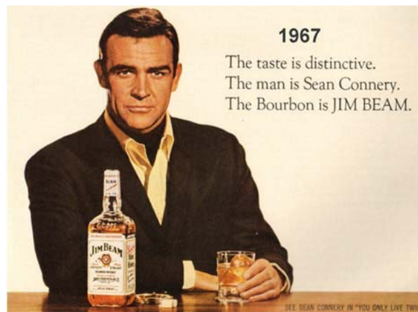
Figura 4. Sean Connery prestando su imagen a Jim Beam Bourbon en la década de 1960

Desde aquella incipiente publicidad a la era actual de las redes sociales, el espectro de posibilidades para sacar el máximo partido de este poder de influencia se ha multiplicado hasta el infinito. Identificar a los líderes de opinión que pueden ayudar a conectar a una marca de forma natural y espontánea con su público objetivo en este momento de saturación publicitaria, es algo de valor incalculable. Desde celebridades –en un extremo de la escala- a amigos –en la otra-, pasando por gente que deja su impronta en diferentes canales de Internet, desde YouTube a Twitter, el abanico de opciones es amplio, y controlar ese poder de influencia ha dejado de ser una opción para las marcas para pasar a ser casi una asignatura obligatoria. Planificar en la medida de lo posible el poder de influencia y contar con las herramientas para rentabilizarlo es igualmente mandatorio.