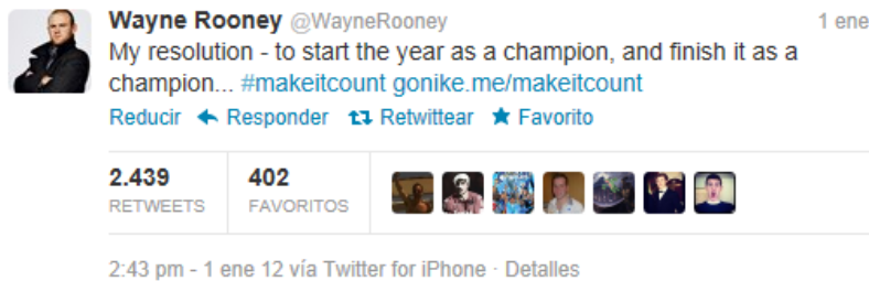
Figura 10. Tuit de Wayne Rooney para la campaña de Nike #makeitcount

Nike. En el primer caso, el mensaje incluía la etiqueta de la campaña publicitaria de la marca deportiva (#makeitcount) y un enlace a la página web, pero la resolución de The Advertising Standards Authority (ASA) estimó la reclamación contra el tuit al considerarlo publicidad encubierta e instó a Nike a retirar el controvertido mensaje, reclamando que se identificaran futuras campañas similares para evitar cualquier riesgo de confusión. Para el ASA, ni la estructura ni el contenido del tuit revelaban suficientemente su carácter promocional y, contrariamente, su diseño y tono hacían pensar que se trataba de un mensaje personal y espontáneo.