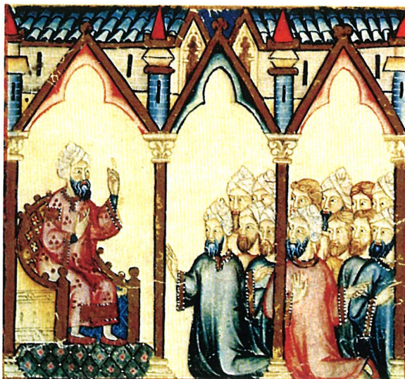
Maestro con sus discípulos. Imagen parcial extraída de las Cantigas de Alfonso X el Sabio, cantiga nº 181, del códice de la Biblioteca del Monasterio de el Escorial.

Por el contrario, su sucesor Muḥammad I (238-273/852-886), verá una ofensiva normanda conjunta contra el norte del Magreb y el sur de Al-Andalus entre el 858 y 861. Hacia el 244/19 abril 858-7 abril 859, una gran flota de normandos vio rechazadas sendas tentativas de desembarco en el litoral gallego y en el Guadalquivir. Ante estas circunstancias, tras asaltar Algeciras, se dividieron en dos secciones: una se dirigió hacia las costas marroquíes, desembarcando en Arcila y Nekor (Al-Bakrī, 92, 111; Dozy, 1987: 24-27, 31-33) y la otra dobló el Cabo de Gata y viró en dirección hacia la Cora de Tudmīr. Por el curso fluvial del Segura ascendieron hacia la fortaleza de Orihuela y la asaltaron. Ibn Ḥayyān (377-469/988-1076), el historiador más antiguo que da fe de este asalto, escribió: