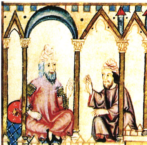
Maestro de religión, alfaquí, debatiendo sobre la unicidad de Dios. Detalle parcial de la ilustración de la cantiga 187a del código del Monasterio de el Escorial de las Cantigas de Alfonso X el Sabio .

que además se dice que a resultas de la expedición, se acabó “recaudando mucho tributo de sus regiones”. 10 No se habla, por tanto de destrucciones, sin aportarse más datos o precisiones.