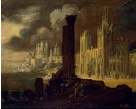
Fig. 4. Obra de Desiderio Monsù