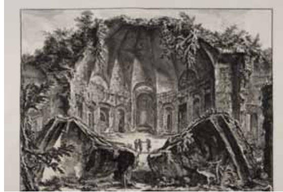
Fig. 5. Gravats de Piranesi

«Els ciutadans no són més que els dipositaris d'un ben del que la comunitat té dret a demanar-los comptes. Els bàrbars i els esclaus detesten la ciència i destrueixen les obres d'art, els homes lliures les estimen i les conserven.»