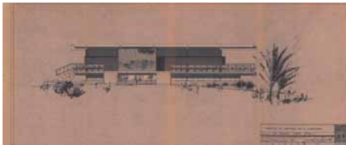
Fig. 13. Plànol original del restaurant La Isleta de Ruiz Olmos.