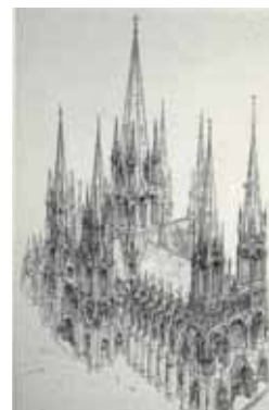
Fig. 7. Catedral gòtica segons Viollet-le-Duc.

«No s'ha d'introduir cap innovació ni en les formes ni en les proporcions ni en els ornaments de l'edifici que en resulte, si no és per a excloure elements que en un temps posterior a la seua construcció van ser introduïts per caprici de l'època següent.»