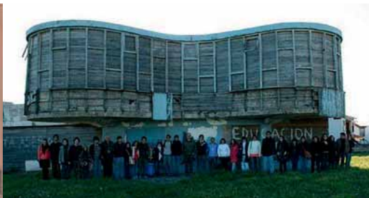
Fig. 14. El parador Ariston.

I acabe amb dos casos de ruïna moderna: El parador Ariston al Mar del Plata, realitzat el 1948 per Marcel Breuer, està abandonat i espera ser recuperat; i el pavelló espanyol de l'Expo de Xangai del 2010, projectat per Benedetta Tagliabue, El Cistell , és avui un garbuix de ferros, però, afortunadament serà reconvertit en centre cultural.