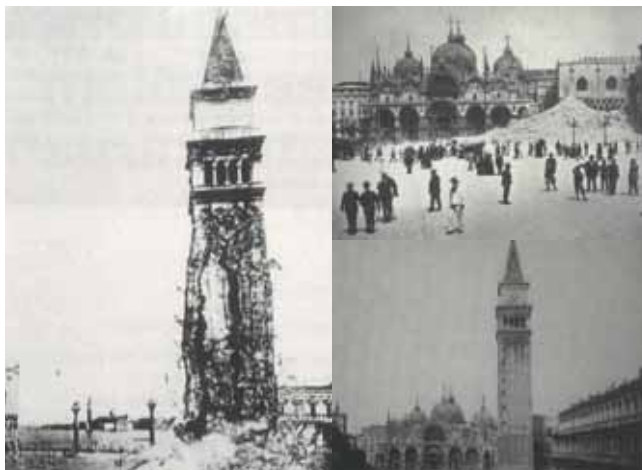
Fig. 9. San Marco Venècia, col·lapse i restes del Campanile