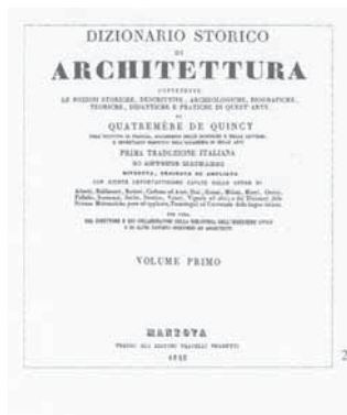
Fig. 6. Diccionari de Quatremère de Quincy