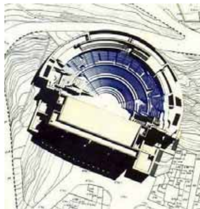
Fig. 11. Teatre de Sagunt

Historicoartístic Nacional, però ha estat molts anys abandonada i fins i tot va ser incendiada el 2004, encara que felixment ha sigut restaurada aquests últims anys (fig. 12).