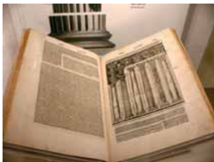
Fig. 2. Tractat de Vitruvi, edició 1521.

En el segle XVII i principi del XVIII les ruïnes són, sobretot, un ingredient de la pintura paisatgística. El quadre de Desiderio Monsù (fig. 4) mostra la ruïna combinada amb l'arquitectura.