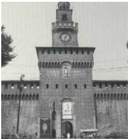
Fig. 8. Castell dels Sforza restaurat per Beltrami