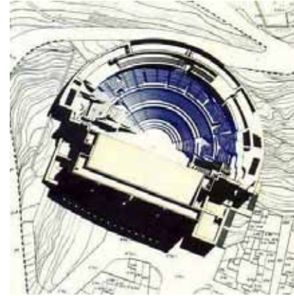
Fig. 11. Teatro de Sagunto

También la Bauhaus que construyó Walter Gropius en 1925 en Dessau pasó por un estado de ruina y ha sido afortunadamente recuperada.