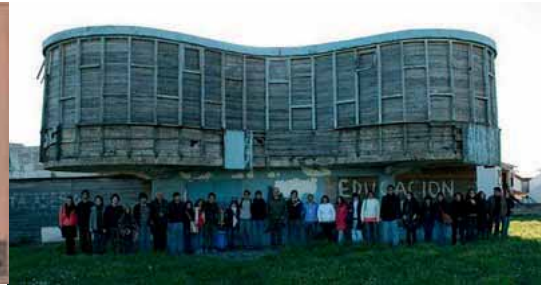
Fig. 14. El parador Ariston.

Y termino con dos casos de ruina moderna: El parador Ariston en Mar del Plata, realizado en 1948 por Marcel Breuer , está abandonado, a la espera de ser recuperado y el pabellón español de la Expo de Sanghái de 2010, proyectado por Benedetta Tagliabue “el cesto” es hoy un amasijo de hierros, pero, afortunadamente será reconvertido en centro cultural.