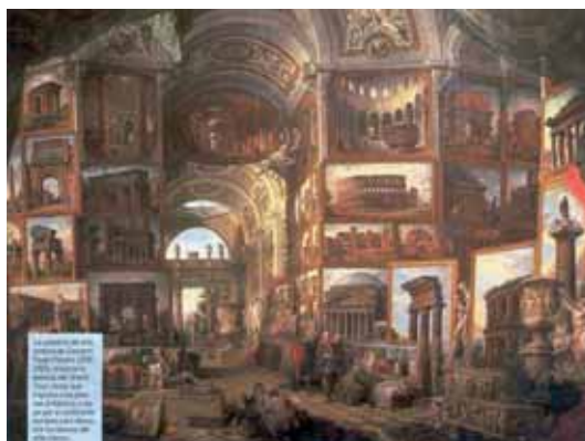
Fig. 1. La catedral del arte de Pannini.

Es muy difícil determinar lo que es o no ruina; si es o no posible recuperar esos restos de edificios y ciudades destruidas por diversas causas. Ejemplos no faltan. Todos conocemos la catastrófica erupción del Vesubio que en el año 79 arrasó Pompeya, o el abandono de ciudades como la inca de Sacsayhuaman en Cuzco, la de Machu Pichu o la maya de Tikal. La singular pobla de nueva fundación levantada en el Peñón de Ifach en 1297 por Roger de Llúria, almirante de la Corona de Aragón, apenas duró 50 años debido a su erróneo asentamiento.