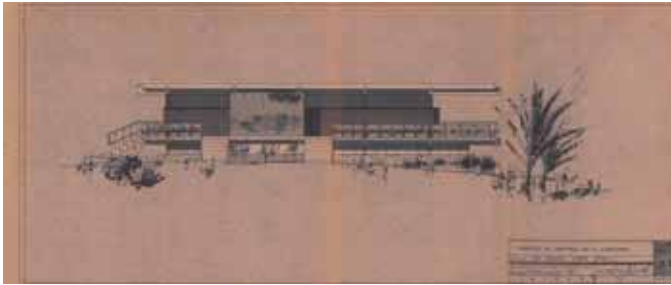
Fig. 13. Plano original del restaurante La Isleta de Ruiz Olmos.

Debo citar también edificios desaparecidos como el Restaurante La Isleta, Alicante, de 1967, obra de Julio Ruiz Olmos (Fig. 13), claro exponente de la modernidad, que fue derribado con nocturnidad en 2007.