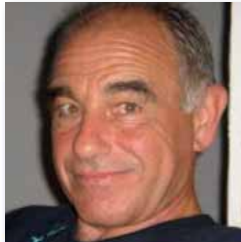
por Miguel Luis Cereceda Catedrático de Materiales y Técnicas de Restauración

EL PATRIMONIO EDIFICADO. De la ruina a la arquitectura. Del pasado al presente.