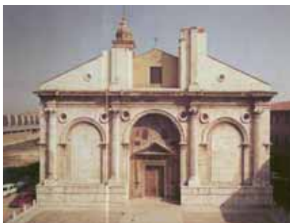
Fig. 3. San Francesco, Rimini, de León Batista Alberti.