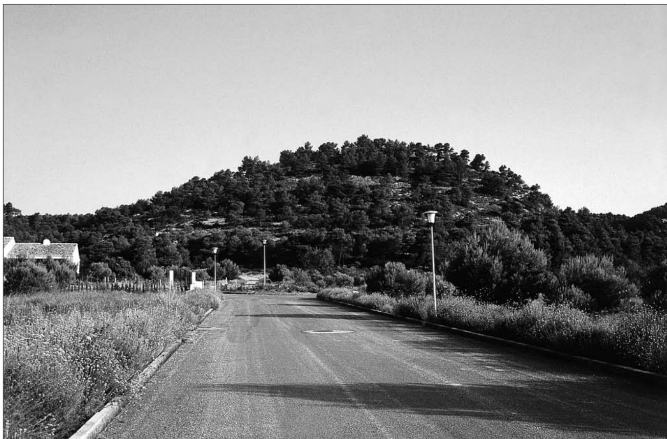
Lámina 11. Mas del Corral (Alcoy).

cerámicos y tres inhumaciones humanas. También se localizaron otros enterramientos de al menos dos individuos en el interior de una grieta de la ladera, donde asimismo se recogieron fragmentos cerámicos y algunos molinos barquiformes. En la Mola d'Agres han continuado las excavaciones que en su día se realizaron bajo la dirección de M. Gil-Mascarell con extraordinarios resultados (Gil-Mascarell y Peña, 1994, Peña et alii , 1996), revelando los nuevos trabajos la complejidad de su arquitectura, la riqueza de los ajuares (Grau et alii , 2004) y la presencia de restos humanos, entre los que se encuentra la inhumación de un individuo masculino de 17-22 años en una fosa abierta en la estructura de refuerzo exterior del muro que rodea al poblado con un extraordinario puñal de remaches de cobre que por su tamaño, tipología y composición se relaciona con la metalurgia argárica, entre el Bronce Antiguo y Medio (Martí Bonafé et alii , 1996).