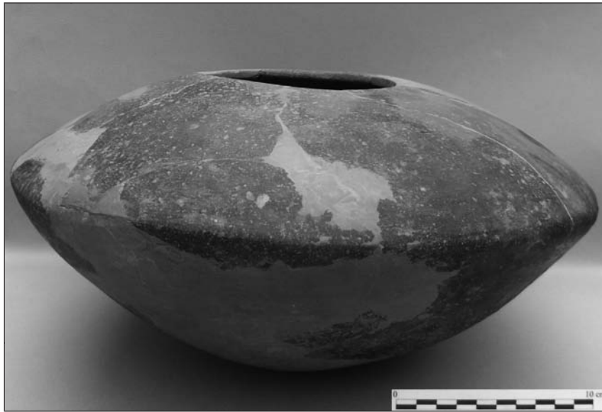
Lámina 6. Vasija lenticular de San Antón (Orihuela). Museo Arqueológico Comarcal de Orihuela.