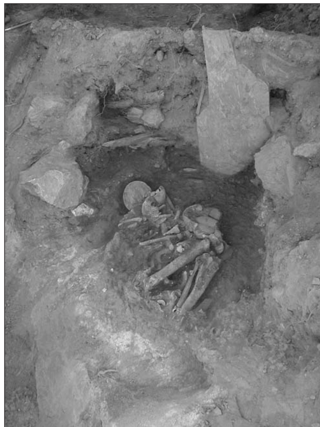
Lámina 8. Cabezo Pardo (San Isidro/Granja de Rocamora).

Otros muchos poblados del Bajo Segura y Bajo Vinalopó, todos en altura, han sido identificados como argáricos, aunque la información disponible sobre ellos se reduzca a recogidas de materiales descontextualizados, entre los que no se registra la presencia de copas ni tampoco de restos humanos. Tras una sistemática revisión de la documentación existente, en gran parte inédita y fruto de sus trabajos de campo, J.A. López Padilla señala