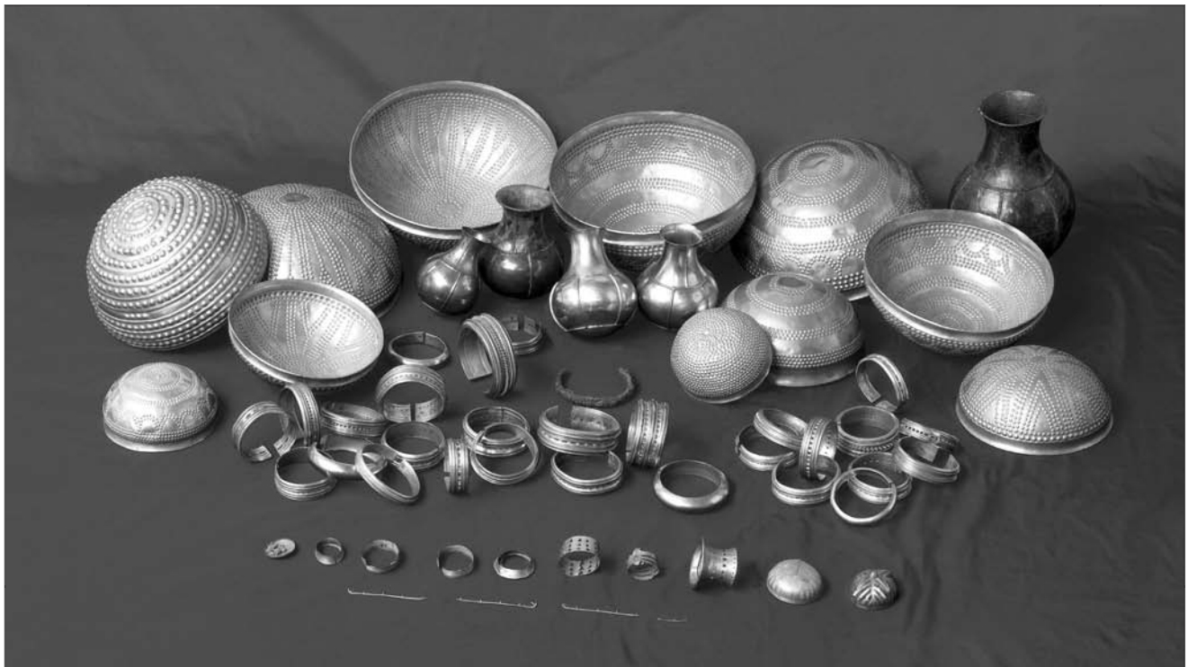
Lámina 17. Tesoro de Villena.