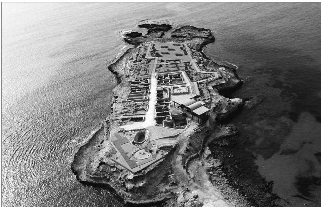
Lámina 9. Illeta dels Banyets (El Campello).

la presencia de 20 yacimientos con una cronología de c. 2500-1500 cal a.n.e., al tiempo que evalúa sus dimensiones y emplazamiento para concluir que existe “un mayor grado de jerarquización en el ámbito argárico del Bajo Segura que en el territorio periférico adyacente” (López Padilla, 2009b, p. 254).