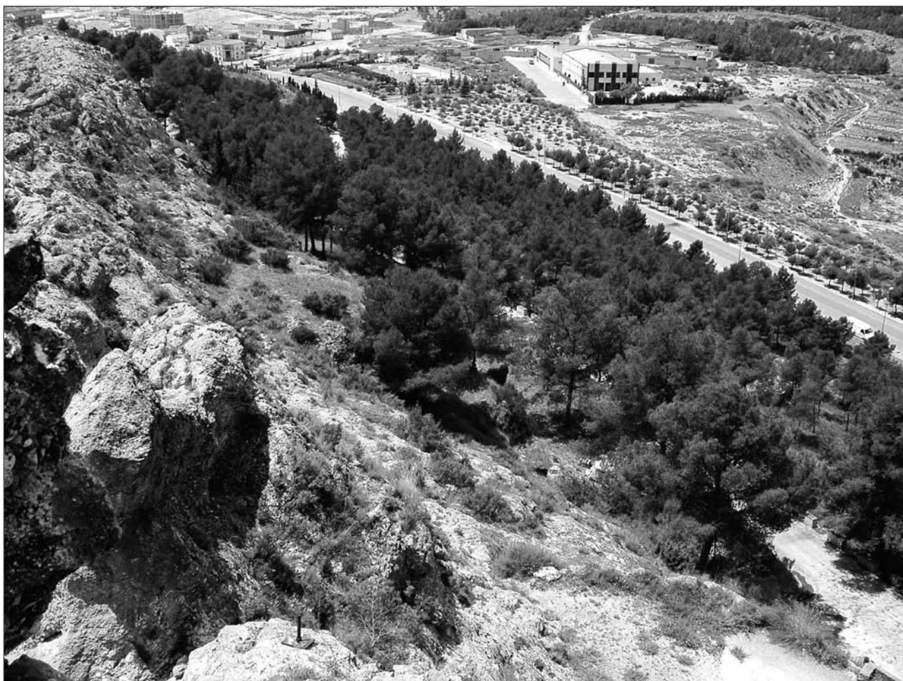
Lámina 14. Laderas del Castillo de Sax.

(Jover y Segura, 1992/1993; Navarro, 1992), destaca la presencia de pesas de telar cilíndricas con perforación central y de dos fragmentos cerámicos decorados, uno de ellos con impresiones en forma de espiga y una línea asociada y el otro con triángulos enfrentados realizados con técnica de boquique. El primero de estos fragmentos recuerda “a la tradición meseteña de Protocogotas” (Delibes y Abarquero, 1997, p. 119).