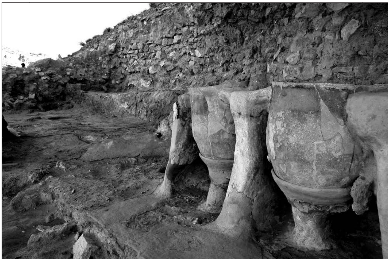
Lámina 13. Cabezo Redondo.

riqueza de materiales registrados en estos últimos. Estas diferencias entre los dos sectores excavados sugieren la existencia de barrios con una cierta especialización en cada uno de ellos (lámina 13).