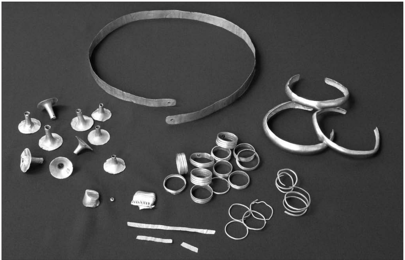
Lámina 16. Tesorillo del Cabezo Redondo.