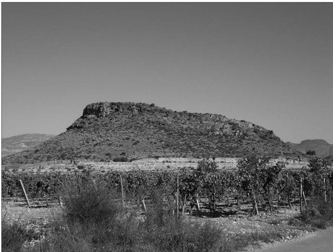
Lámina 15. El Negret (Agost).

otras más pequeñas (López, 1996; Simón, 1988), y en las recientes excavaciones una cuenta de collar de pasta vítrea y fragmentos de un brazalete de marfil.