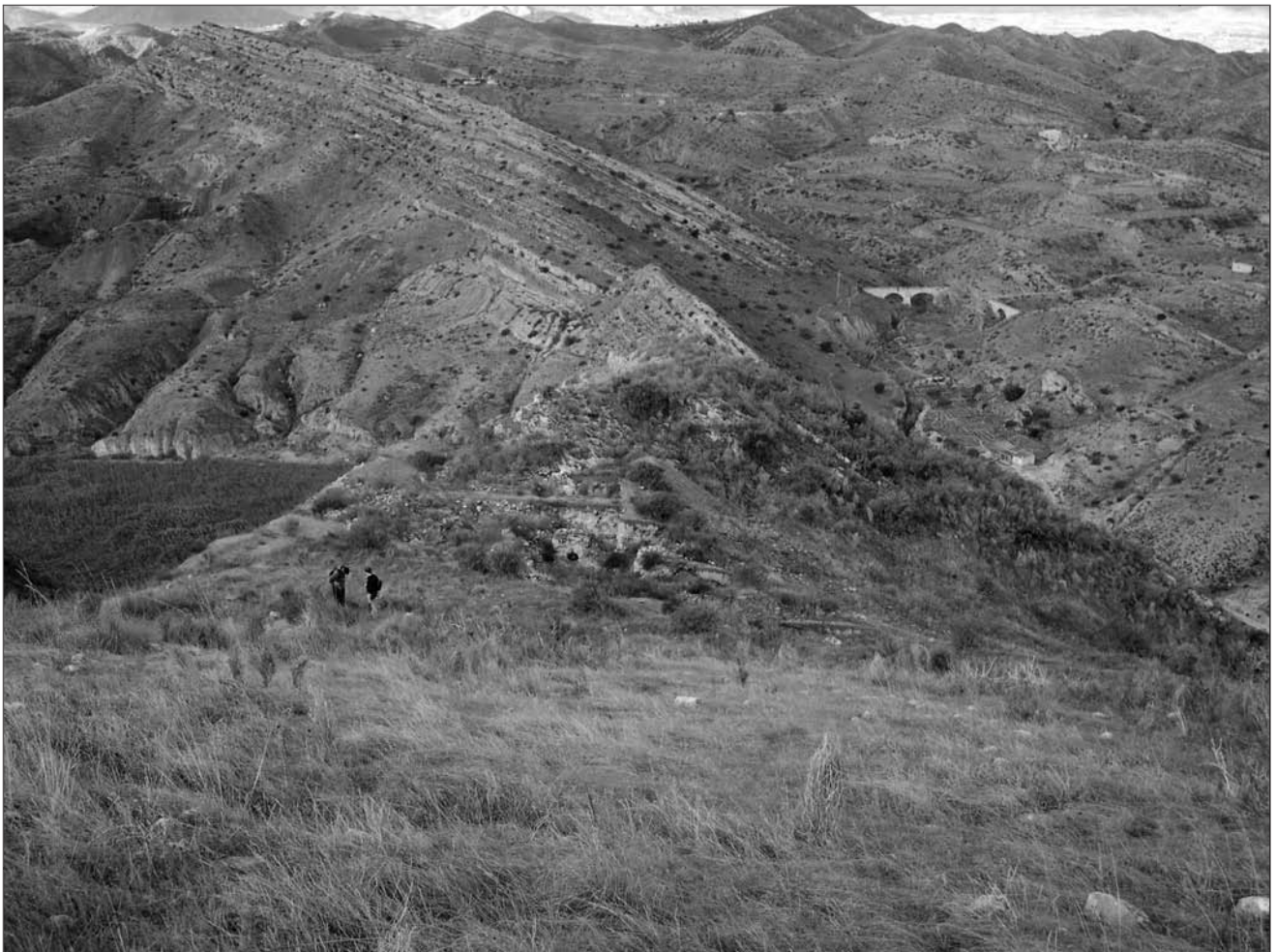
Lámina 7. Tabayá. Excavaciones en la plataforma inferior.