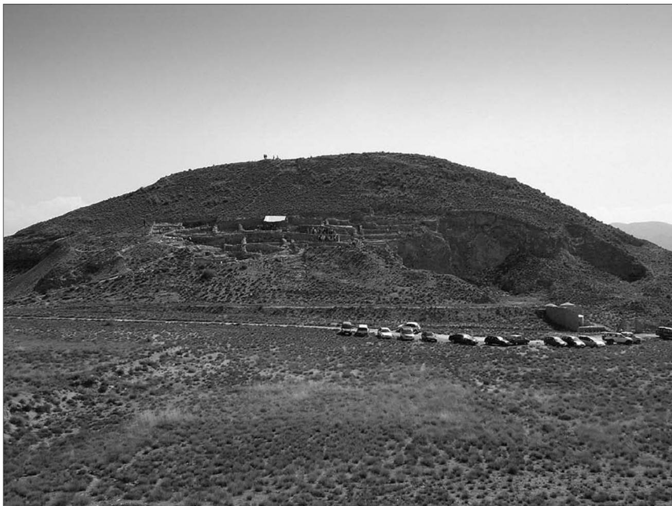
Lámina 12. Cabezo Redondo (Villena). Ladera occidental.

En posteriores síntesis sobre los momentos finales de la Prehistoria en el País Valenciano se sustituye (Mata, Martí e Iborra, 1994/1996) el término Bronce Tardío por el de Bronce Reciente que se sitúa, siguiendo anteriores propuestas, en fechas sin calibrar entre el 1300/1200-1100/1000 a.n.e., al mismo tiempo que incorporan al