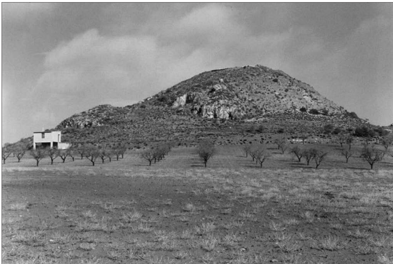
Lámina 10. Terlinques (Villena).

La documentación sobre la Prehistoria Reciente en las cuencas media y alta del Vinalopó se podría calificar de excelente, ya que las prospecciones han sido intensas y sistemáticas y el número de excavaciones con sus correspondientes dataciones absolutas es, si se compara con el resto de las tierras valencianas, elevado. A partir de esta información, que se ha incrementado en las últimas décadas, se han propuesto varias fases, desde la inicial de J.F. Navarro Mederos (1992) a la más reciente