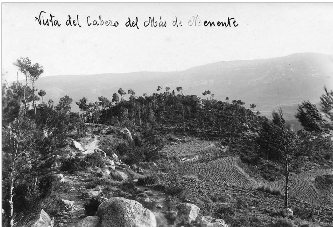
Lámina 3. Mas de Menente (Alcoy).

y otras varias que se encuentran diseminadas por todo el litoral, habiéndola conceptualizado los arqueólogos como una verdadera civilización costera que parece terminar en Cataluña” (Ponsell, 1926, p. 7-8). También para la Illeta dels Banyets de El Campello se insiste en que “aparece la cerámica pulimentada propia de la cultura argárica” (Figueras Pacheco, 1934, p. 41), influencias argáricas que se hacen extensivas a todas las tierras valencianas, incluso en el propio título de algunas de las aportaciones de aquellos años (Alcácer, 1945).