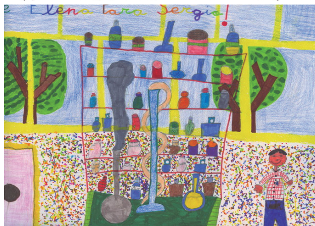
Figura 1. Dibujos del Laboratorio Mágico realizados por alumnos de 1º y 2º de primaria.