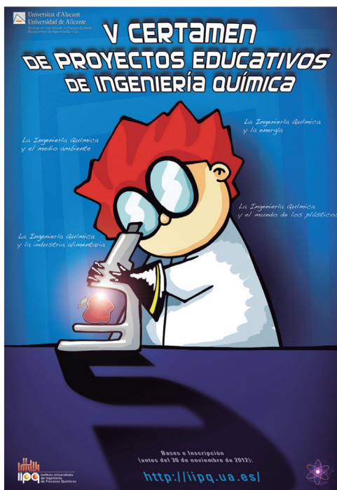
Figura 2. Cartel anunciador del Certamen de Proyectos Educativos de Ingeniería Química que convoca el I.U. de Ingeniería de Procesos Químicos de la Universidad de Alicante.