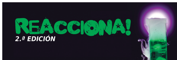
Figura 3. Logo del concurso Reacciona organizado por la Ciudad de las Artes y Las Ciencias.