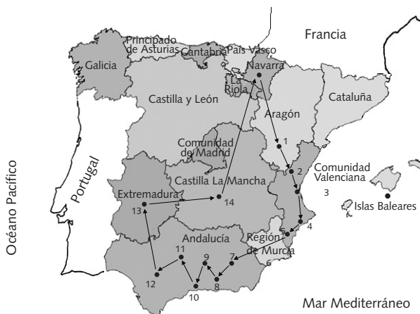
FIGURA 2. Itinerario seguido por las reliquias de san Gregorio Ostiense durante 1756

Claves: 1= ciudad de Teruel, 2= Diócesis de Segorbe, 3= D. de Valencia, 4= ciudad de Alicante; 5= Diócesis de Orihuela, 6= D. de Murcia, 7= D. de Guadix, 8= D. de Granada, 9= D. de Jaén, 10= D. de Málaga, 11= D. de Córdoba, 12= D. de Sevilla, 13= Provincia de Extremadura, 14= Provincia de La Mancha (Elaboración: C. Alberola Die).