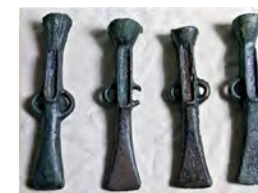
Hachas talón y doble anilla