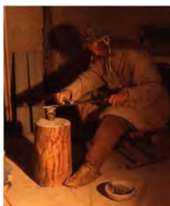
A Bronze Age metal worker shaping a sword blade. Pfalzhausmuseum Urteufeltingen, Germany.