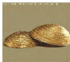
Cuencos de Axtroki