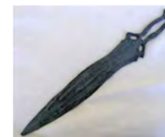
Espadas de lengua de carpa