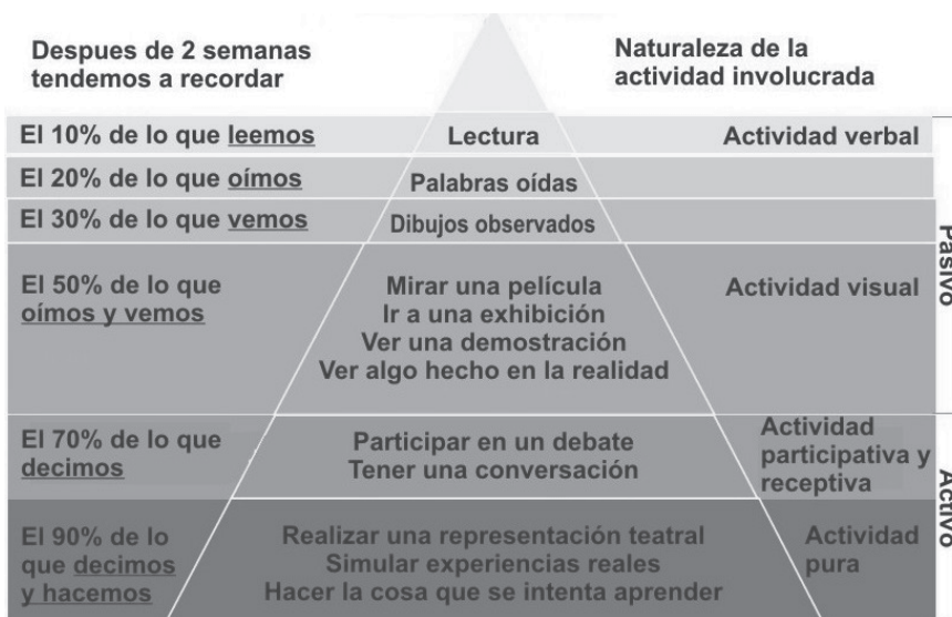
Figura 1. Cono de aprendizaje de Dale.