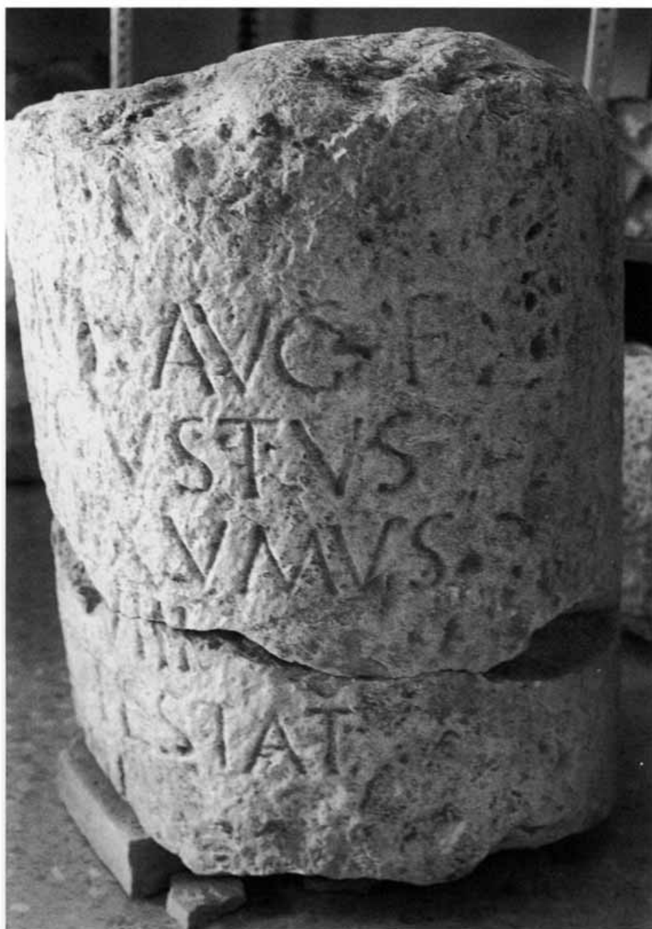
Figura N.º 4.