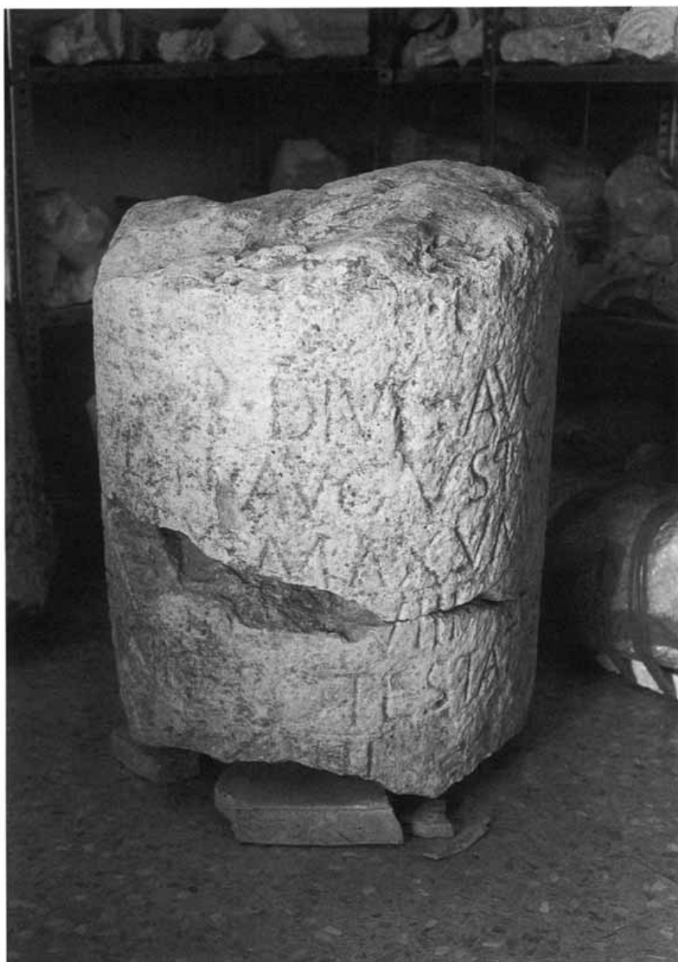
Figura N.º 3.