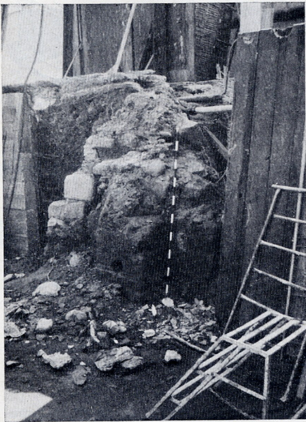
FIG. 1. Restes de murs antics apareguts en les obres de fonamentació d'una casa situada a la cantonada dels carrers Anselm Clavé i Cardenal Remolins de Lleida.

Pel costat oposat, i sota la casa veïna,