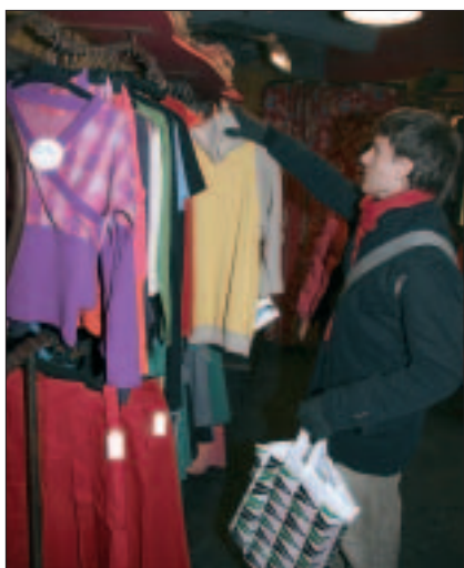
CUADRO N° 6