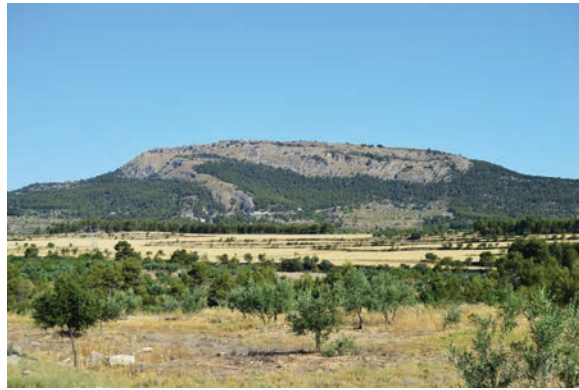
Figura 4. El Pitxocol. Balones.