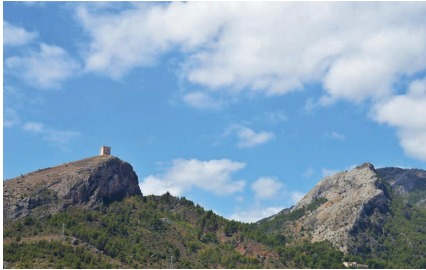
Figura 12. Castell de Cocentaina i l'Alberri.