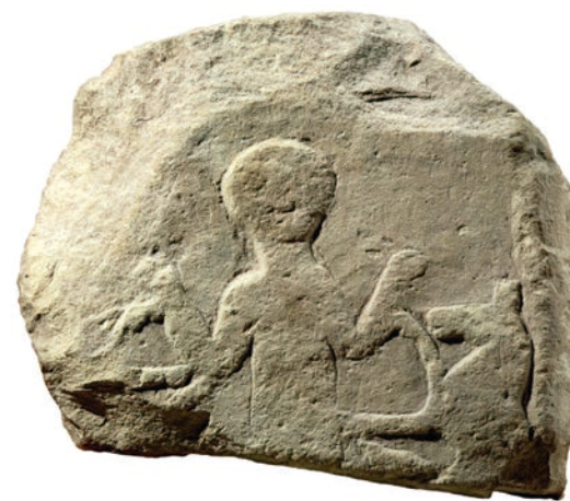
Figura 8. Sepultura de la necròpolis de la Serreta (Alcoi-Cocentaina-Penàguila).

Un altre referent ritual dels ibers eren els espais funeraris. Enterraven als seus difunts en necròpolis on dipositaven les restes humanes després d'haver sotmés els cossos mitjançant la pràctica del ritual de cremació. A les tombes també dipositaven els objectes que componien els aixovars funeraris, i on destaquen les armes que acompanyaven als homes adults. Altres peces d'aixovars destacades són els adornaments, les terracotes i especialment les copes i plats de ceràmica importada. De nou la Serreta ha proporcionat un registre funerari destacat a les nostres comarques (Cortell et al. , 1989) (Fig. 8).