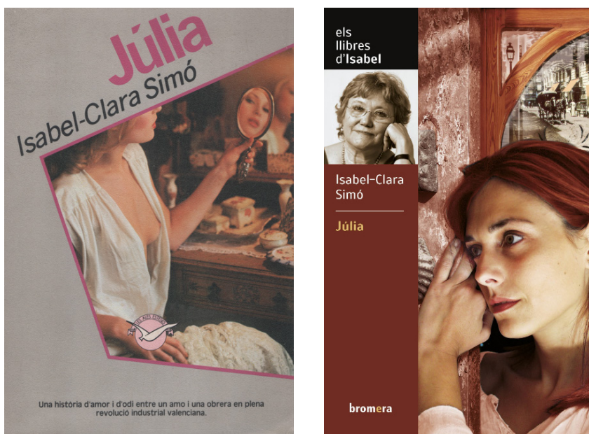
Figura 1. Portades de la primera i la darrera edició de Júlia .

La frase final era: «Catòlica havia de ser!». Tot i açò, la narració es va publicar a La Magrana l'any 1983. La portada de la primera edició ens mostrava una Júlia que s'emmira alhora que una cita ens anunciava que ens trobavem davant «D'una història d'amor i d'odi entre un amo i una obrera en plena revolució industrial valenciana». En canvi, a la portada de la darrera edició ja no cal presentar de què tracta la novel·la. Un quadre modernista acompanya una Júlia pensativa.