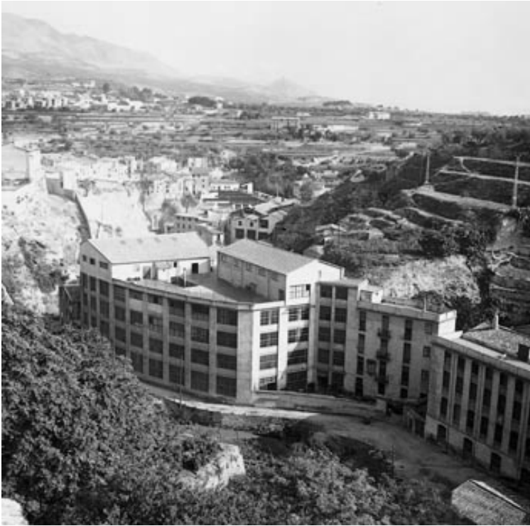
Figura 3. Fàbrica Hijos de Miguel Payá a la partida de Tossals i Molins.