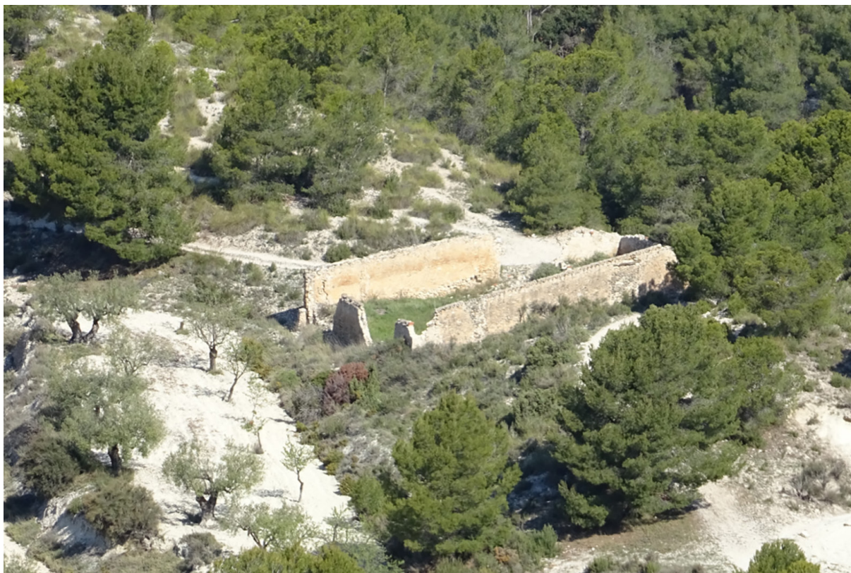
Imatge actual del corral-descansador de la Gurrama (també conegut com a corral dels Bous), situat en la sendera del Sit.

solien passar almenys una nit en els descansadors i corrals com els de la Gurrama, les Coves del Riu (a la caseta del tio Raspall) i l'antic corral de la placeta de la Foia.