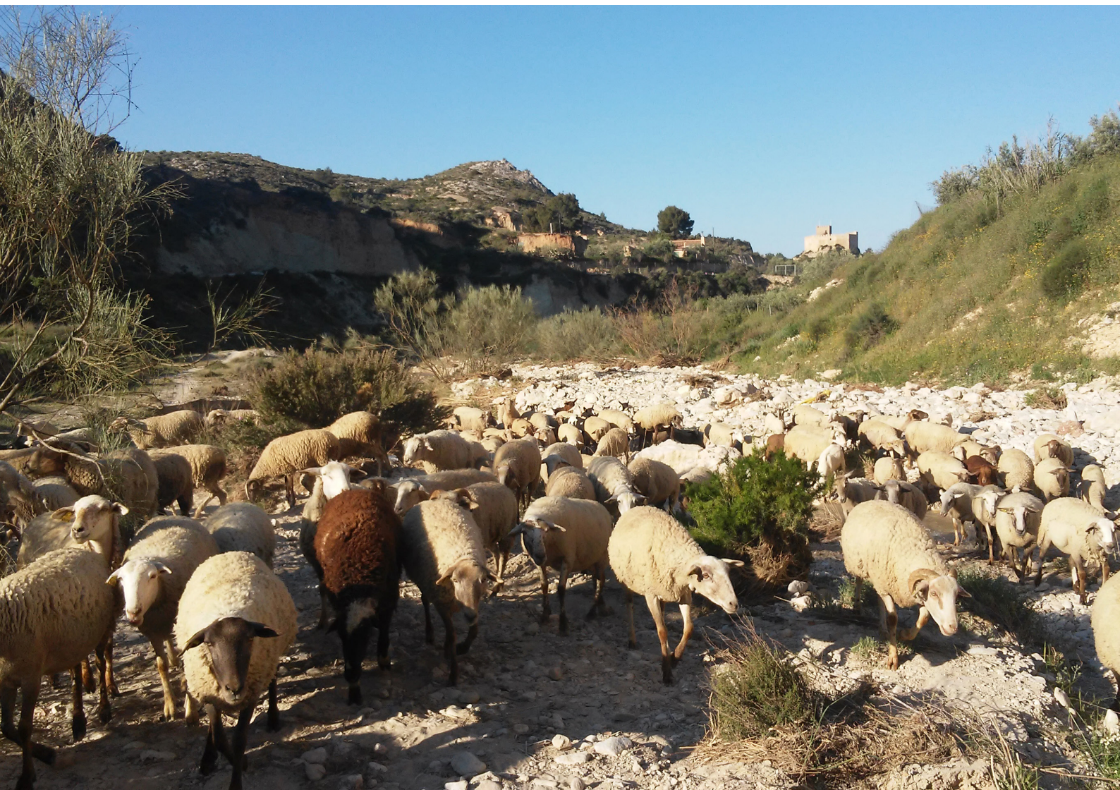
Un ramat transita per les Coves del Riu a través de la sendera de Cati, via pecuària que coincideix parcialment amb la rambla de Puça. Primavera de 2017.

La transhumància és una modalitat de pasturatge consistent en el desplaçament estacional de les ramades per rutes migratòries. En el vell continent, tots els anys, durant la primavera i la tardor milers d'ovelles, cabres, vaques o cavalls són conduïts entre regions climàtiques a la recerca d'aliment i refugi durant les estacions d'hivern o d'estiu. És una pràctica ancestral i que té, encara hui, un paper fonamental en la preservació de la biodiversitat i dels paisatges, a partir d'una cultura pastoral transhumant profunda i meticulosa.