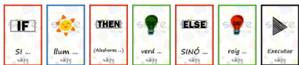
Figura 5: Ejemplo de programación modo avanzado.