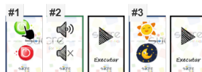
Figura 3: Ejemplo de programación del modo básico.

Actualmente se cuenta con tres modos de juegos diferentes. Cada uno de ellos se adapta a diferentes niveles educativos y conceptos del pensamiento computacional. En el primer modo, el básico, se trabaja el concepto de condicionales. Este va dirigido al nivel educativo de infantil y primer ciclo de primaria (1º y 2º curso). El modo básico ofrece dos tipos de car-