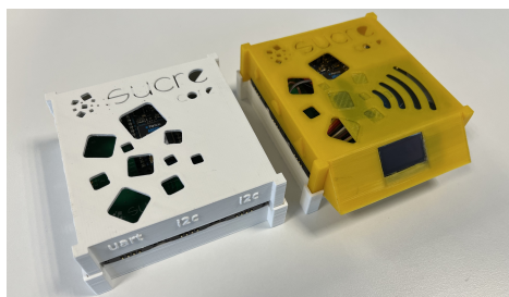
Figura 1: SucreCore en Sucre4Stem (izquierda) y Sucre4Kids (derecha).