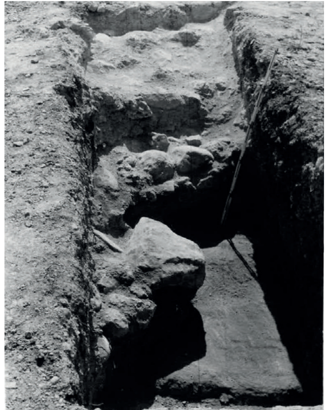
Figura 19.6. Detalle del primer sondeo practicado en 1981 por R. Ramos Fernández.

Siguiendo las notas de R. Ramos Fernández, el yacimiento presentaba, en lo que a registro estratigráfico se refiere, al menos dos niveles de ocupación relacionables con dos pavimentos registrados en el espacio A (figs. 19.6 y 19.7), a su vez amortizados