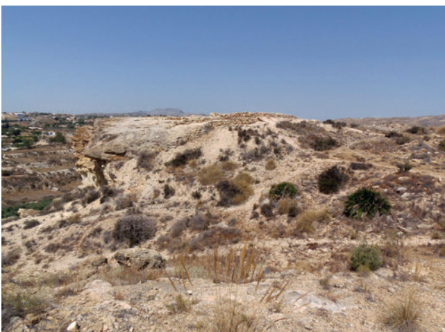
Figura 19.2. Vista del espelón de Caramoro I, en el que se puede observar su altura respecto del curso del río.

de parte del nivel superior de conglomerados (Pignatelli, 1973). El espolón que ocupa Caramoro I presenta una caída en vertical en buena parte de su trayectoria, con excepción de su lado oriental. De este modo, la superficie máxima que delimita el muro de cierre del asentamiento no supera los 500 m 2 , habiendo empleado más de 250 m 2 en su delimitación, con la construcción de diversas estructuras de gran porte, siendo muy destacado el empleo de la piedra. El acceso al asentamiento solamente se podría efectuar por una pequeña zona abierta, situada en su extremo nororiental.