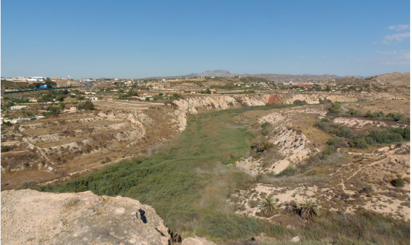
Figura 19.1. Vista del curso del río Vinalopó desde Caramoro I.

Caramoro I está directamente edificado sobre un conjunto estratificado de materiales pliocenos, básicamente calizas y conglomerados. El agua, debido a su alta porosidad y permeabilidad, se filtra con suma rapidez. Debajo de tales conglomerados aparece un nivel de margas arcillosas triásicas de coloración ocre-blanquecina y verdosa a medida a que se humedece. Geomorfológicamente estos dos niveles dan un relieve típico de murallones con bruscas pendientes (figs. 19.4 y 19.5), debido a que la erosión se realiza en las margas infrayacentes, lo que produce una caída por gravedad