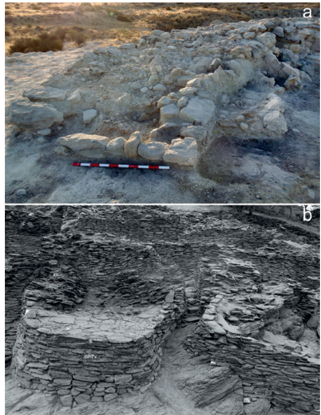
Figura 19.17. Refuerzos constructivos. a. Contrafuerte cuadrangular documentado en el acceso al asentamiento de Caramoro I; b. Contrafuertes (aunque ya restaurados y recrecidos) en Peñalosa (Baños de la Encina, Jaén) (Contreras et al. , 1993).

Por último, merece mencionarse que Caramoro I guarda significativas concomitancias con otros asentamientos bastante alejados, como Piedras Bermejas (Baños de la Encina, Jaén) (Contreras et al. , 1993), localizados en el extremo noroccidental del territorio argárico, en la cuenca del Rumblar. Este emplazamiento, definido como un asentamiento estratégico tipo fortín, es conocido por las actuaciones llevadas a cabo para su documentación planimétrica y topográfica. Se caracteriza por su reducido tamaño –ocupando una superficie de 750 m 2 –, la existencia de un recinto de planta piriforme con unas dimensiones máximas de 32 m de longitud por 22 m de anchura, y la presencia de potentes muros con un grosor que oscila entre 1,60 y 2 m. En él se distinguen dos espacios diferentes, una torre de tendencia circular en el ángulo sureste para reforzar la entrada –similar a las docu-