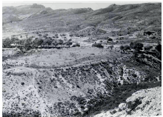
Figura 19.3. Vista del yacimiento calcolítico de Kalathos desde Caramoro I, tomada por Rafael Ramos Fernández en 1981. Fondos del MAHE.